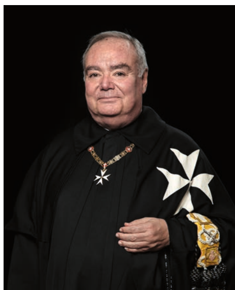
Le Grand Maître, S.A.E. Fra' John T. DUNLAP (depuis 3 mai 2023)

Fidèle à sa vocation, l'Ordre Souverain de Malte continue aujourd'hui dans plus de cent vingt pays son service d'assistance aux malades, aux pauvres et aux déshérités. L'Ordre Souverain de Malte est présent dans de nombreux secteurs d'activité tels que l'assistance médico-sociale, les secours aux victimes de conflits armés ou de catastrophes naturelles, les services d'urgence, la gestion d'équipes de premiers secours, l'assistance aux personnes âgées, aux handicapés, aux enfants en difficulté, l'enseignement, les cours de formation de secourisme, des actions d'intervention en faveur des réfugiés et des migrants. Depuis plus de neuf cents ans, l'Ordre Souverain de Malte agit en toute neutralité dans le monde sans distinction de race, d'origine ou de religion.