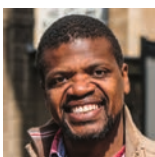
Jean-Michel SENGA Back to School (jusqu'au 7 décembre 2022)