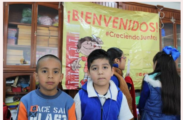
San Vicente Chicoloapan, Estado de México