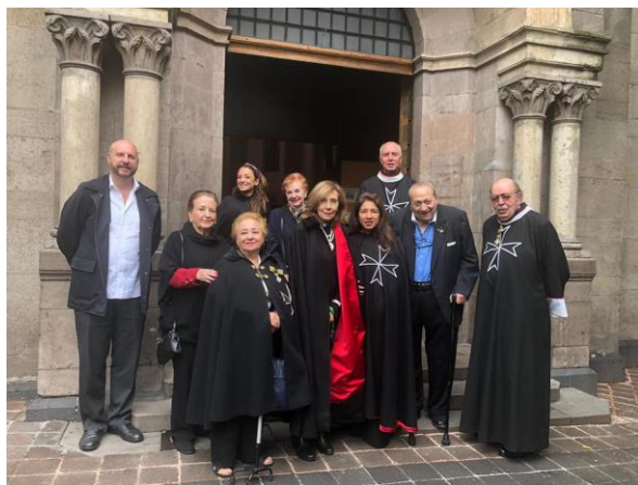
Miembros e invitados de la Orden de Malta México en la celebración Eucarística.

“Yo te prometo, en el exceso de la misericordia de mi corazón, que mi amor omnipotente concederá a todos los que comulguen los primeros viernes de mes, durante nueve meses consecutivos, la gracia de la penitencia final, y que no morirán en mi desgracia, ni sin recibir los Santos Sacramentos, asegurándoles mi asistencia en la hora postrera.”