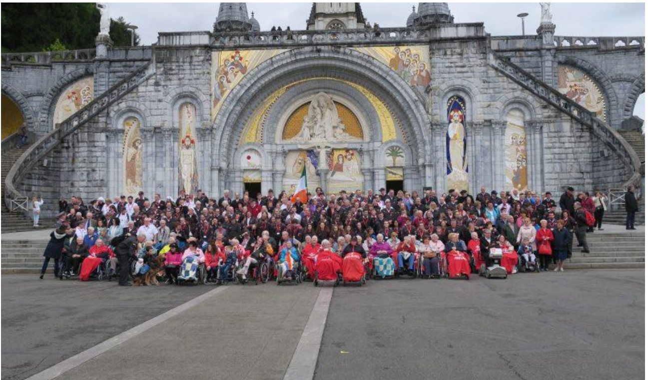
Asistentes a la 61ª peregrinación internacional de la Orden de Malta a Lourdes.

En su discurso a los peregrinos, durante la ceremonia de entrega de medallas de participación, Frey Giacomo Dalla Torre del Tempio di Sanguinetto, refirió: «Agradezco a todos ustedes, queridos peregrinos, su participación, su devoción y su fe, y el inextinguible “espíritu de equipo” de nuestra amada Orden de Malta en este santuario mariano. Queridos peregrinos, avancemos juntos, enriquecidos por las bendiciones que recibimos en este lugar santo de María, con renovada energía, esperanza y valor frente a los desafíos del futuro».