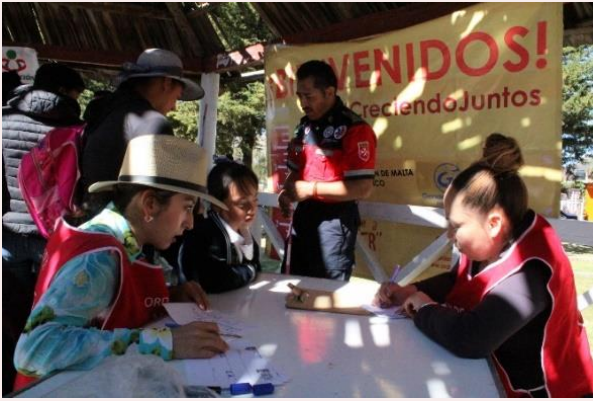
El Llano, Apan, Hidalgo