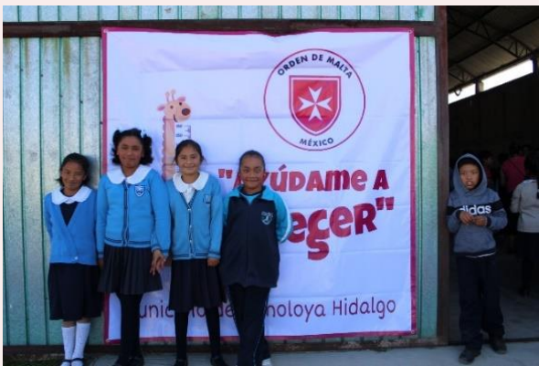
Rancho Nuevo, Apan, Hidalgo