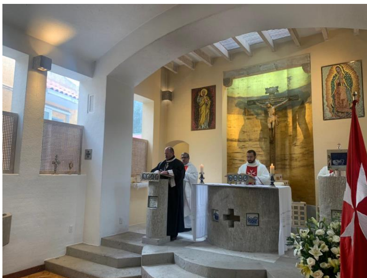
Capilla de “La Rinconada” en la Nunciatura Apostólica en México,