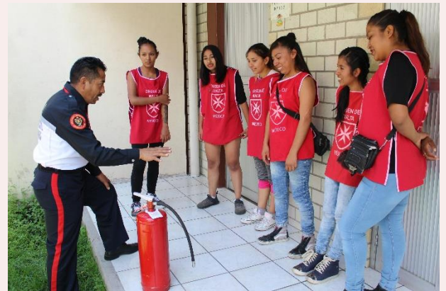
Taller de primeros auxilios y Capacitación en caso de un desastre natural.