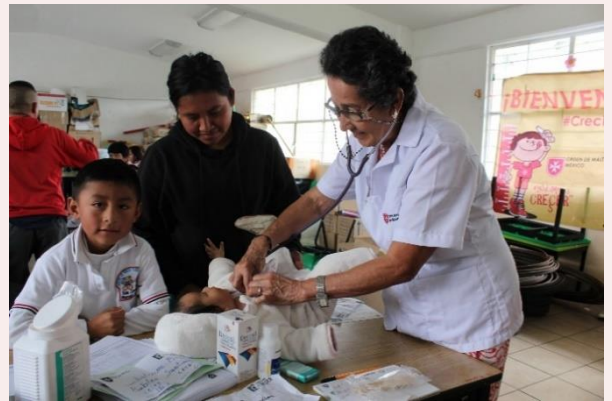
San Cayetano, Toluca, Estado de México