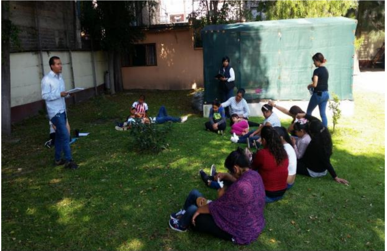
Niños en terapia Grupal en la zona de Iztapalapa.

Brindar a 20 niños un tratamiento continuo para disminuir conductas de riesgo de los trastornos generados por los sismos de alta magnitud del 07 y 19 del septiembre del 2017.