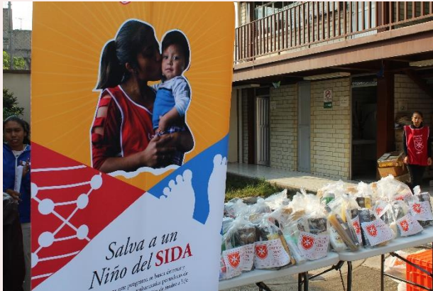
Donación de productos de higiene personal por Genomma Lab.