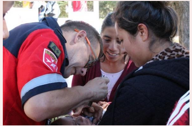
Las Vigas, Apan, Hidalgo