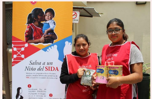
Donación de leche de fórmula y Linconsa.