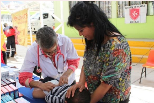
San Martín de las Pirámides, Estado de México