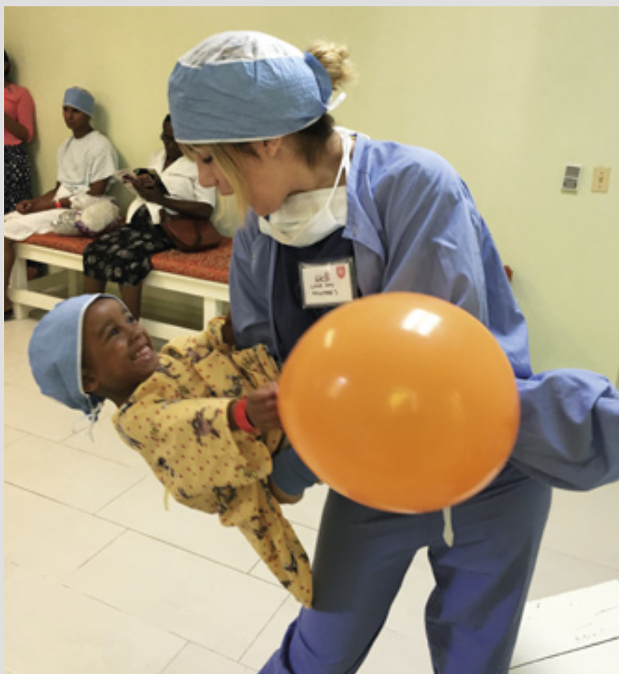
▲ L'association dominicaine apporte des soins maternels et infantiles dans les zones pauvres de Saint-Domingue

trousses d'hygiène individuelles et 30 000 tablettes de purification d'eau. Un programme de prévention et de secours en cas de catastrophes a été développé en 2016 pour les communautés près de Ciénaga, dans la région de Magdalena. A Pâques 2016, 80 systèmes d'eau portatifs ont été donnés à Galerazamba (Atlántico) où, pendant plus de deux mois, il y a eu une pénurie d'eau potable.