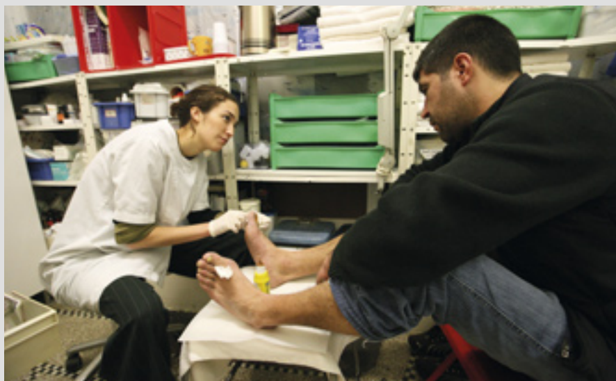
▲ Trois centres de jour pour sans-abris en Belgique offrent des douches, une blanchisserie, des repas chauds, des vêtements et des soins médicaux de base