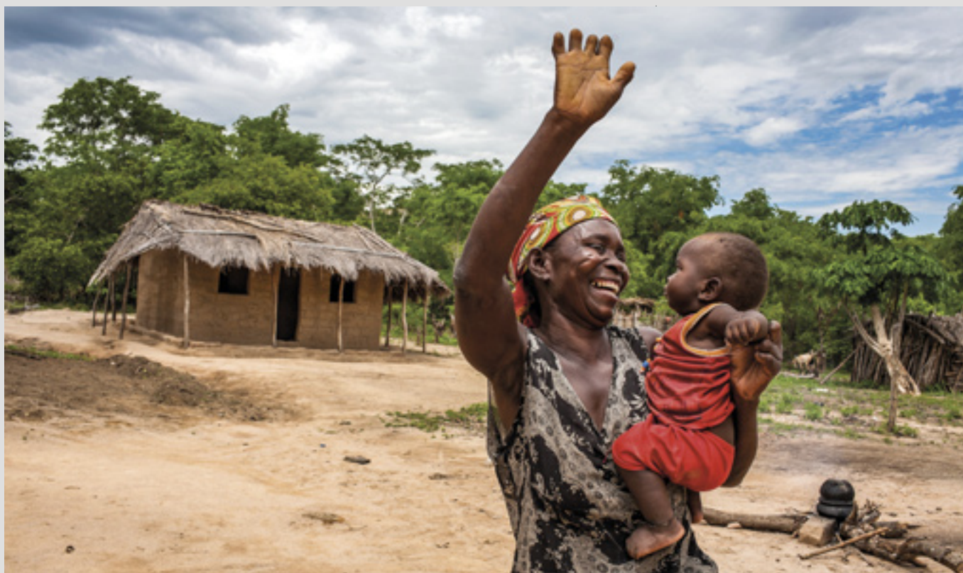
▲ L'Ordre s'occupe des malades de la lèpre, leur montrant comment prendre soin d'eux-mêmes