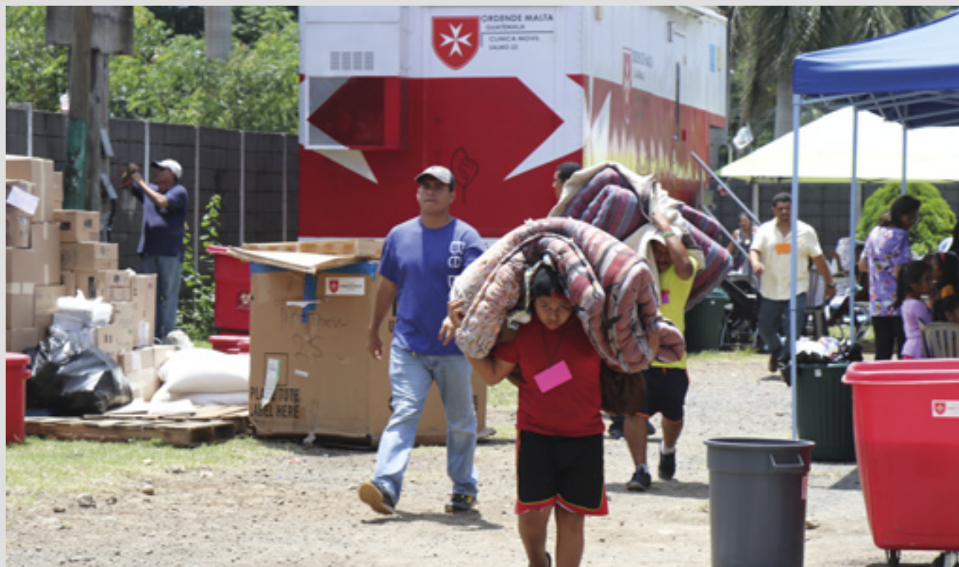
▲ Une clinique mobile au Guatemala fournit des biens de première nécessité aux villages isolés après l'éruption du volcan

L'association guatémaltèque continue de soutenir le réseau de santé national avec du matériel médical jetable et du matériel hospitalier qu'elle distribue aux centres de santé, hôpitaux et pompiers urbains. Elle fournit également des suppléments alimentaires à environ 500 enfants défavorisés et 75 personnes âgées chaque année. Près de la basilique guatémaltèque de la Sainte Vierge du Rosaire, l'association dirige une unité médicale mobile avec 6 médecins, 4 psychologues et 4 infirmiers. En 2017, ils se sont occupés de plus de 5 100 patients. Services fournis : consultations médicales et psychologiques, urgences et dons de fauteuils roulants, de béquilles et de déambulateurs. Depuis 2014, l'Ordre offre des bilans oncologiques gratuits aux femmes. Un centre d'alimentation pour enfants dans la ville de Guatemala procure de la nourriture à 100 enfants par jour. Le