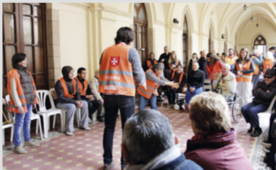
▲ Argentine : la participation à des activités et des jeux est une aide pour les hôtes handicapés

Le programme Hôtel de Malte à Buenos Aires fournit des soins palliatifs aux malades du cancer dans les familles pauvres, pour 30 patients externes par jour et assure des visites à domicile chez 100 personnes en plus en moyenne. La soupe populaire "2 de Abril" dans la région de Buenos Aires nourrit 200 enfants défavorisés par jour et héberge la crèche SURSUM (enfants de 0 à 3 ans) et un centre de loisirs pour enfants de 6 à 12 ans. Dans un coin de rue de Buenos Aires, tous les jeudis soirs depuis 2013, des membres et bénévoles préparent et distribuent des repas.