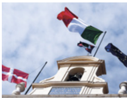
Le drapeau de l'Ordre flotte au-dessus du Palais du Quirinal, siège du Président de la République italienne

par le Grand Chancelier de l'Ordre, Albrecht Boeselager, à la Villa magistrale.