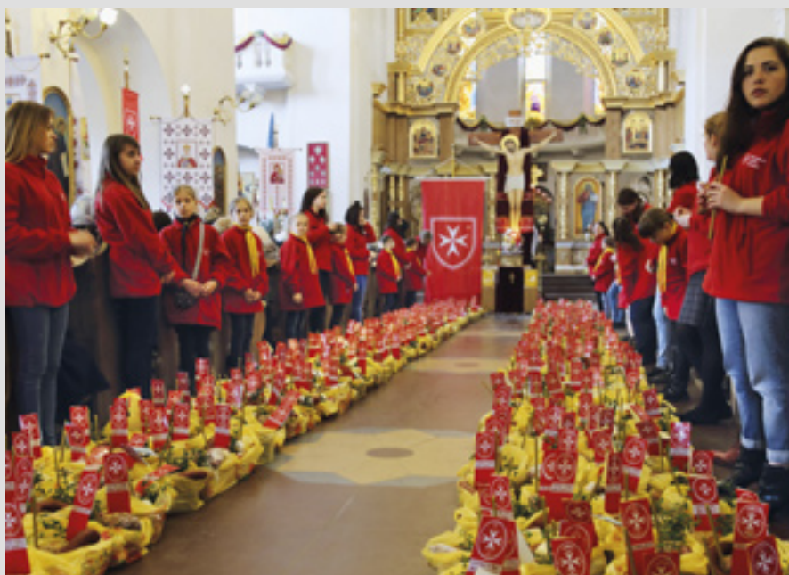
▲ Chaque année à Pâques, le Malteser Relief Service à Lviv en Ukraine, prépare des centaines de paniers pour les personnes dans le besoin