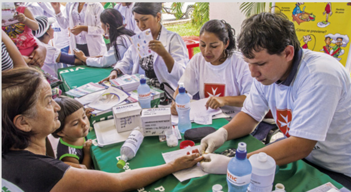
▲ Journée mondiale contre le diabète en Bolivie : l'Ordre collabore avec l'Université de Santa Cruz de la Sierra

La fondation "Mateo 25" à Florencio Varela dans le sud de Buenos Aires offre des soins dentaires et ophtalmologiques gratuits à plus de 100 enfants défavorisés par jour. Pour les cas complexes, elle dispose d'un accord de coopération avec l'Université de La Plata. L'association gère aussi un poste de premiers secours lors du pèlerinage annuel de l'Ordre à la Basilique Notre-Dame de Luján.