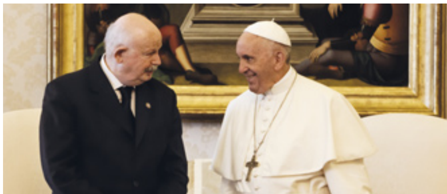
Sa Sainteté le pape François accueille le Grand Maître pour l'audience annuelle au Vatican