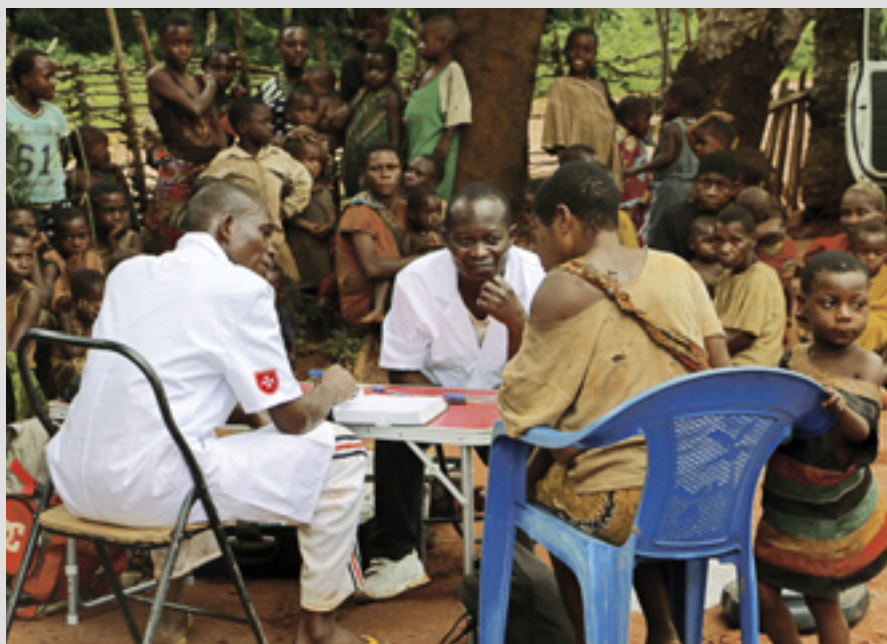
▲ Une clinique mobile dans le nord du Congo apporte des soins aux communautés locales et aux populations autochtones

En 2015, l'ambassade de l'Ordre aux Seychelles a organisé une large donation d'équipement médical issu de l'hôpital S. Orsola de Brescia, récemment démantelé. Le matériel (258 éléments)