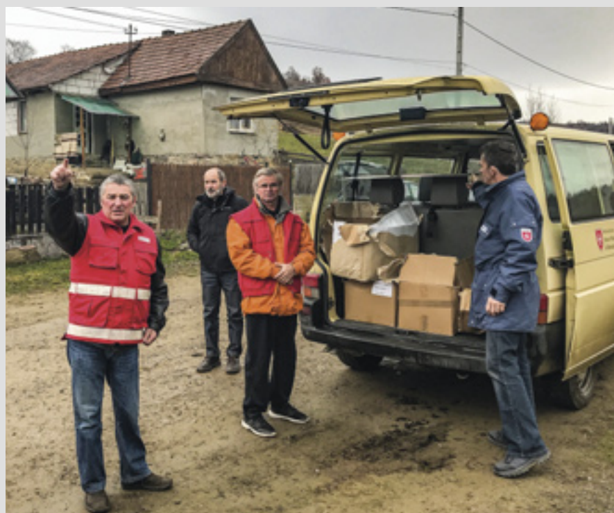
▲ En Europe de l'Est, les livraisons régulières de fournitures aux villages locaux défavorisés sont vitales

L'Association slovène de l'Ordre et son organisation auxiliaire, Order of Malta Aid Slovenia (OMAS), ont entrepris des activités dans le pays en 2016 et 2017. Un défibrillateur a été donné à la cathédrale de Ljubjana, et d'autres pour les centres pour pèlerins à Sveta Gora, Za-