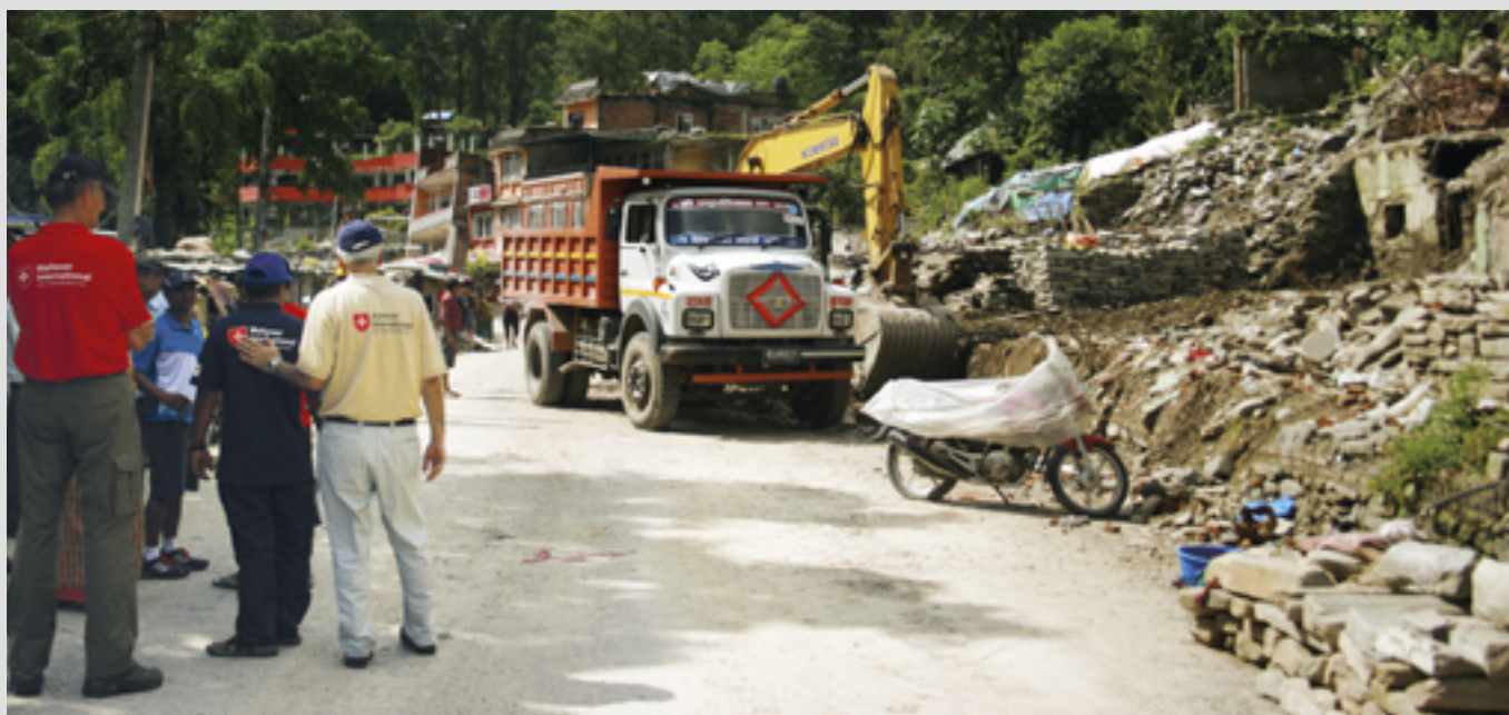
▲ L'agence internationale d'aide humanitaire de l'Ordre, immédiatement sur le terrain après le tremblement de terre au Népal avec une aide d'urgence, reconstruit maintenant maisons et moyens de subsistance

Mère Teresa], d'un point de vue financier et logistique, aussi dans la préparation et la distribution de nourriture et de médicaments aux malades et aux pauvres dans la capitale Astana.