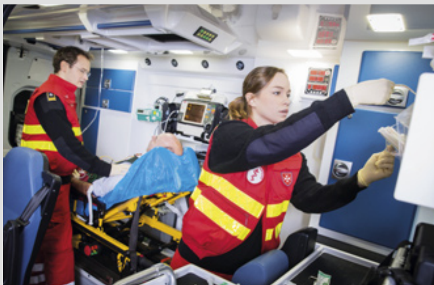
▲ Malteser Hospitaldienst Austria est un service bénévole important dans le pays

L'organisation dirige des services de soins ambulatoires dans 33 villes d'Allemagne. Sont actifs des services sociaux où des bénévoles qualifiés prennent soin de personnes âgées, malades et seules, mettant l'accent sur l'apport de qualité et de joie de vivre. Un service