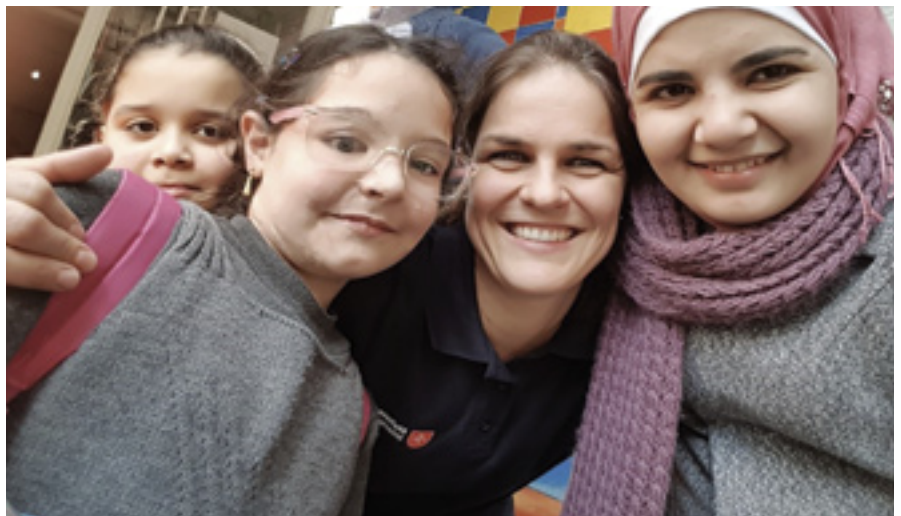
Jeunes réfugiés étudiants à l'école de l'Ordre à Kilis (Turquie), s'intégrant au pays hôte

En plus des soins médicaux à l'hôpital de réadaptation, des psychologues et des travailleurs sociaux ont mis au point un programme de soutien pour les patients et leurs familles. Les patients proviennent d'un milieu culturel où les pathologies psychologiques sont stigmatisées. Il est donc difficile de les encourager à exprimer des sentiments négatifs. Gagner sa vie dans un pays étranger tout en survivant dans des