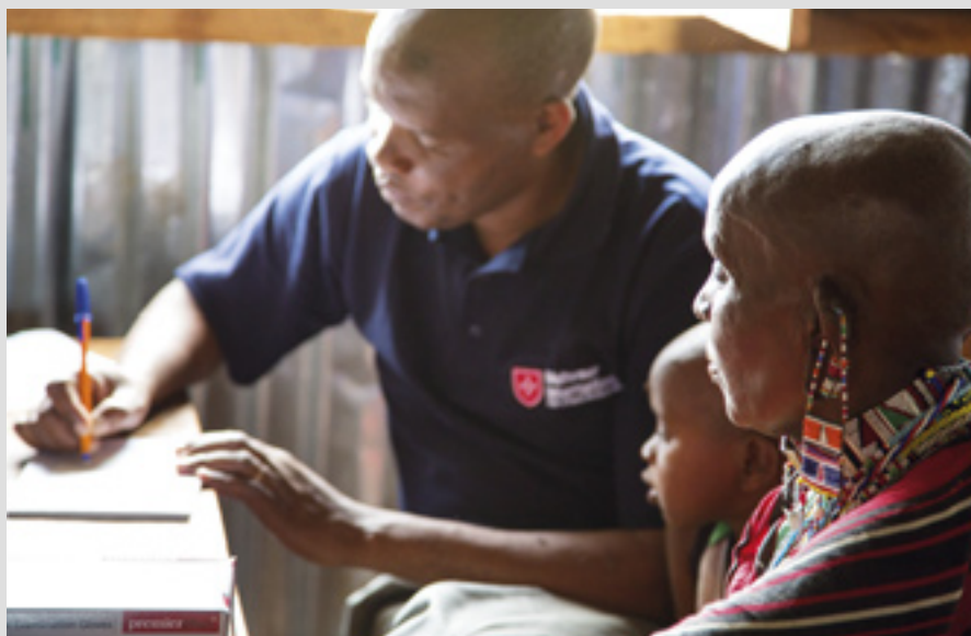
▲ Visite à domicile pour un malade de tuberculose à Oloitokitok au Kenya

Malteser International mène aussi des programmes de lutte contre la sécheresse dans le nord, où hommes et animaux en sont touchés, et contre la grave pénurie alimentaire et sous-nutrition qui en résultent. À Ileret, comté de Marsabit, l'attention se porte sur la fourniture d'eau potable, l'approvisionnement alimentaire, la réduction du bétail, la préservation des pâturages, l'amélioration des conditions hygiéniques et sanitaires, l'éducation de la population locale en préparation de la prochaine sécheresse. Des campagnes de formation et de sensibilisation sur le changement climatique ont également