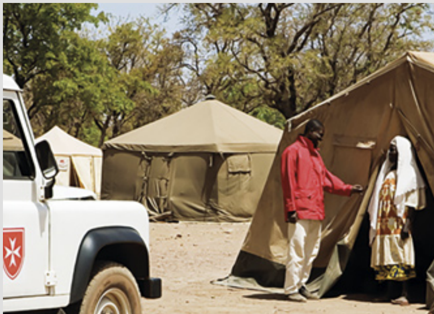
▲ Les équipes d'ambulanciers et de secouristes de l'Ordre au Burkina Faso desservent les zones excentrées avec des examens médicaux et des médicaments gratuits

Une clinique pour la malnutrition offre un service de santé pour les pauvres. Les enfants sous-alimentés sont soignés et nourris et leurs parents apprennent les soins pour bébé et la nutrition. Un found boursier: 242 bourses ont été attribuées en 2017.