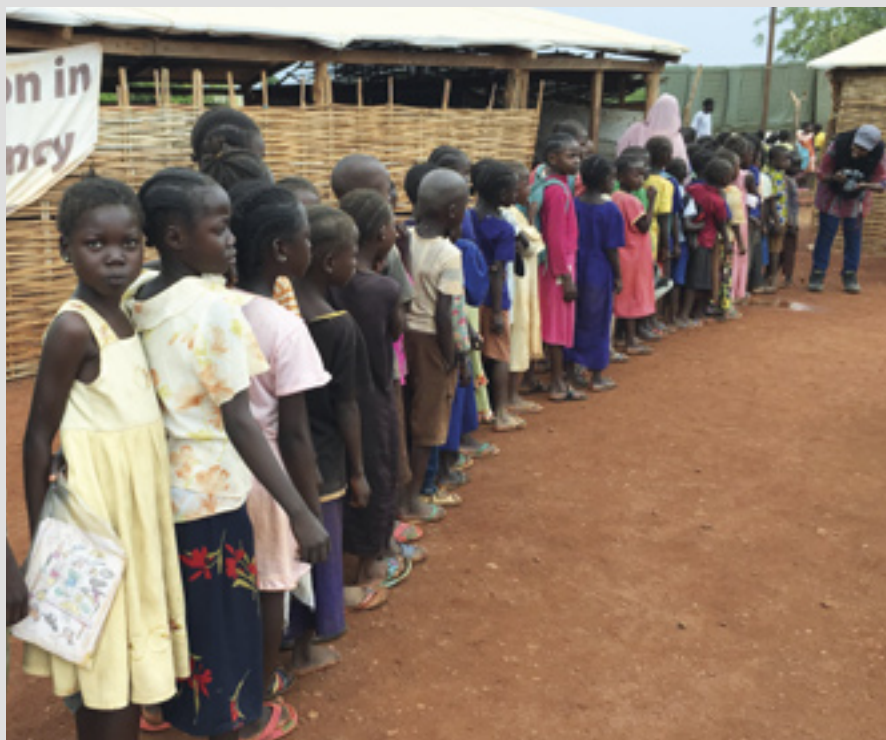
▲ Des écoliers font la queue pour des repas chauds et nourrissants fournis par Malteser International au Soudan du Sud

comprendait des défibrillateurs, un microscope spécial, du matériel de laboratoire, des lits, des fauteuils roulants et des brancards, qui sont désormais utilisés par les hôpitaux d'Anse Royale, de Praslin et de La Digue, le centre pour personnes âgées à North East Point, le laboratoire de l'Hôpital des Seychelles et comme équipement supplémentaire dans les ambulances.