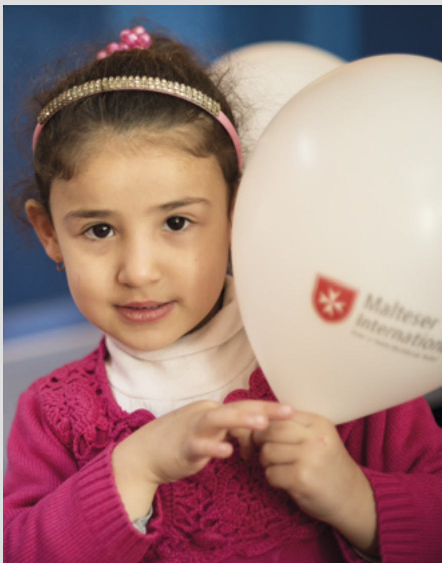
▲ Les soins médicaux et les actions d'enseignement à Kilis promettent aux enfants réfugiés syriens un avenir meilleur

À Kilis, en Turquie, avec une organisation partenaire locale, Malteser International se concentre sur les soins médicaux et psychosociaux pour les réfu-