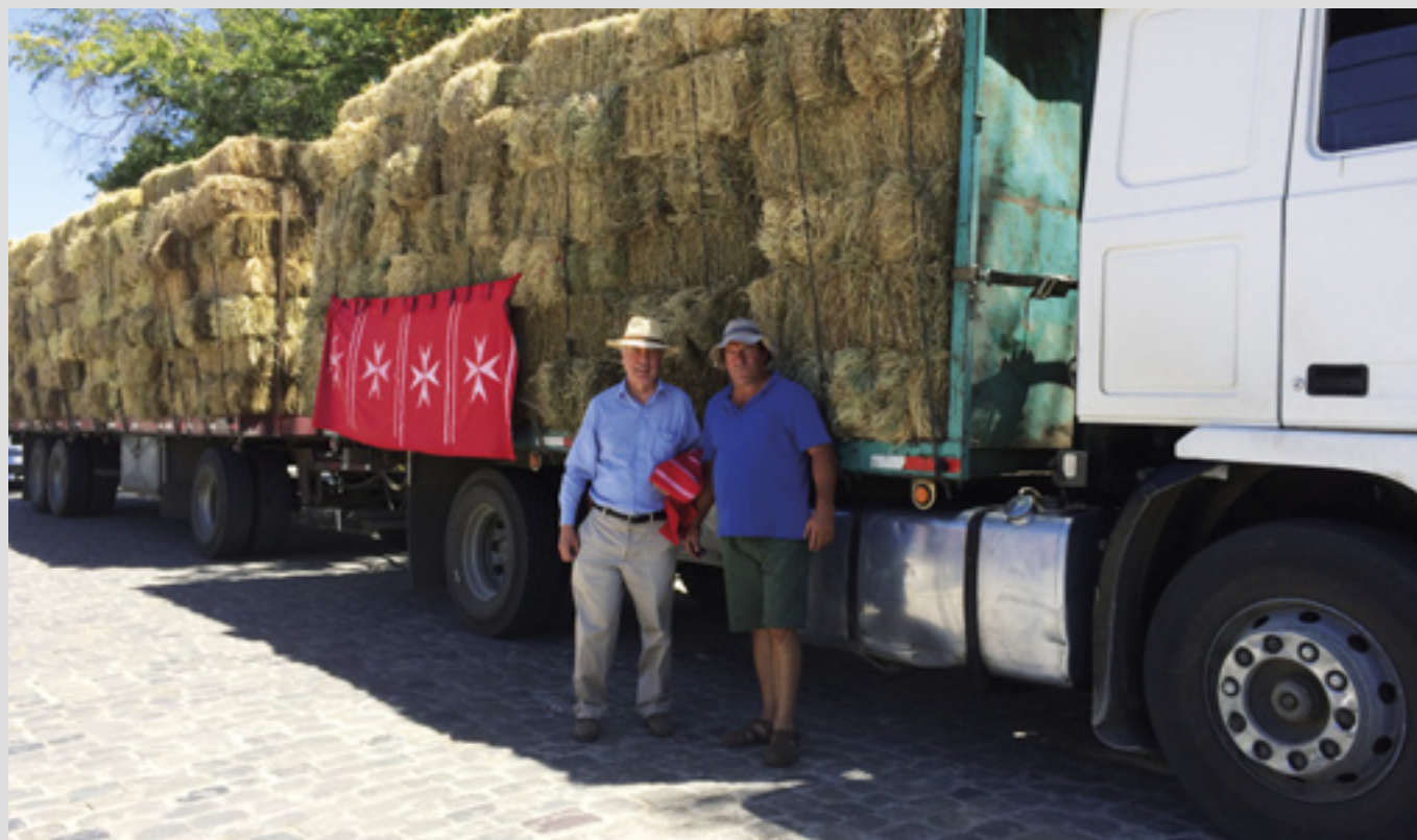
▲ Après les récents feux de brousse au Chili, l'Ordre a fourni des aliments de base pour animaux

La Fondation a trois bureaux régionaux, à Loncoche (800 km au sud de Santiago), Liquiñe (en territoire indien près de la frontière avec l'Argentine) et La Serena (dans le nord). Des bénévoles rendent visite et s'occupent de personnes malades et abandonnées, of-