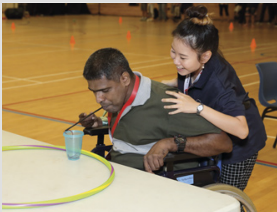
▲ Le camp d'été pour jeunes handicapés d'Asie-Pacifique est aujourd'hui un événement annuel

servoir d'admission et sept réservoirs de distribution, 40 unités de collecte d'eaux de pluie, 30 latrines à fosse communales, des latrines non-mixtes, des moyens de se laver les mains et structures de formation, des digesteurs à gaz biologique, 40 filtres à sable biologiques, gestion du reboisement, missions médicales et dentaires. Les 2 365 bénéficiaires produisent 80% des légumes dans la zone.