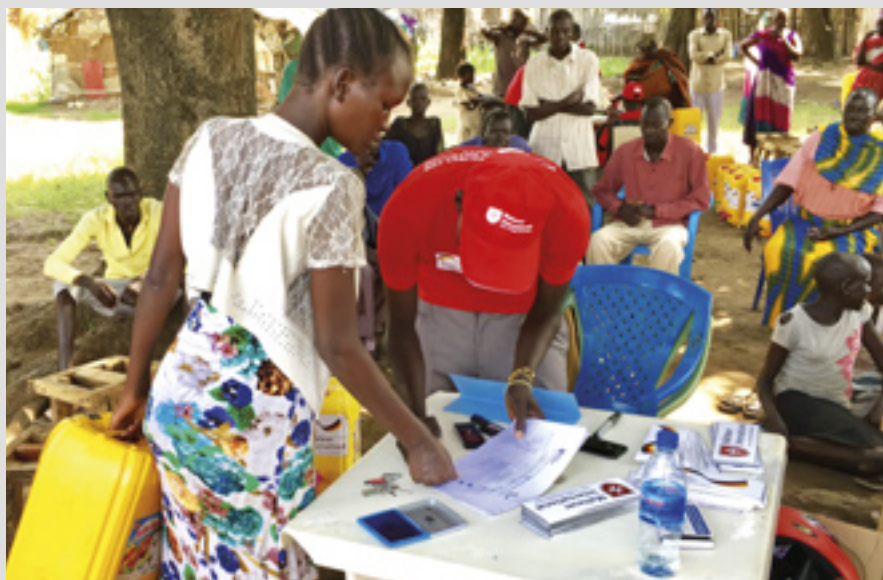
▲ Le travail continue en Afrique pour former les agriculteurs locaux en nutrition agricole et culture des graines

L'Ordre de Malte France est présent en République centrafricaine depuis plus de 30 ans, soutenant des structures de santé dans le pays. Il contribue financièrement au fonctionnement du Centre de rééducation fonctionnelle (CRHAM) de Bangui et y appuie les missions de chirurgie réparatrice infantile d'un chirurgien bénévole. Il soutient aussi 12 dispensaires de santé par l'envoi de médicaments.