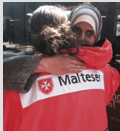
▲ Closeness counts: Malteser Hilfsdienst runs care programmes nationwide

L'Ordre de Malte France travaille en Afrique, au Moyen-Orient et en Asie. Il dirige sept hôpitaux au Sénégal, au Bénin, au Togo, en Equateur, en Palestine, au Cameroun, à Madagascar, avec un total de 528 lits; 160 dispensaires et centres de santé, au Sénégal, au Tchad, au Mali, au Bénin, au Niger, au Congo, en Inde, en Côte d'Ivoire, au Cameroun, en République d'Afrique centrale, en Guinée, au Gabon, à Madagascar, au Liban et en Irak. Un programme de distribution de médicaments soutient des dispensaires en Afrique, envoyant des médicaments et du matériel. Nouveauté en 2016 : un centre de formation pour paramédicaux et secouristes à Njombé au Cameroun. Les programmes pour la prévention de la lèpre sont primordiaux ainsi que les soins au Sénégal (Tilène, Ziguinchor), Cameroun (Guili, Guider et Mokolo), Gabon (Ebeigne), en Inde (Pondichéry et Shadipur), Brésil (Macapa), Egypte (Abou Zabal) et au Cambodge (Kien Khleang et Pnom Penh), Vietnam et Laos. De plus, le programme MALTALEP soutient des équipes internationales de recherches sur la lèpre.