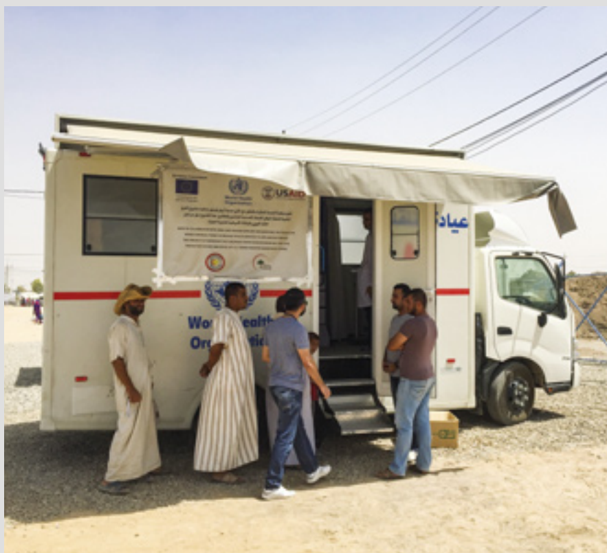
▲ Des équipes mobiles de Malteser International fournissent une aide médicale aux déplacés dans les camps près d'Erbil, en Irak

Pour les personnes âgées en zone rurale, où l'exode des jeunes vers la ville crée la solitude, trois centres de jour et cinq "maisons chaudes" apportent de la compagnie en organisant des activités sociales. Ils répondent à 55 villages