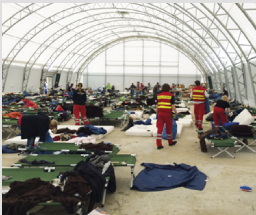
▲ Des réfugiés sont pris en charge à leur arrivée en Autriche. Malteser Hospitaldienst Austria fournit une aide aux personnes dans le besoin depuis 1956

vie pour les Journées mondiales de la Jeunesse et à Rome pour le Jubilé de la Miséricorde.