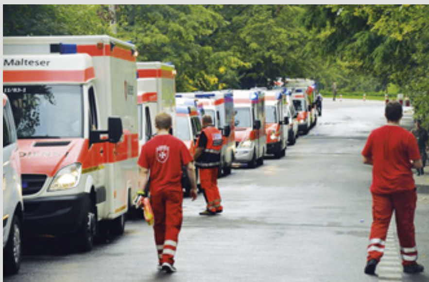
▲ File d'ambulances de l'Ordre, soutien médical pour les Journées mondiales de la jeunesse à Cracovie en 2016

En juin 2014, l'ambassadeur de l'Ordre en Moldavie a ouvert une soupe populaire dans le sous-sol de la cathédrale de Chişinău en coopération avec le centre social Casa Providentia. Depuis, la soupe populaire a servi plus de 19 000