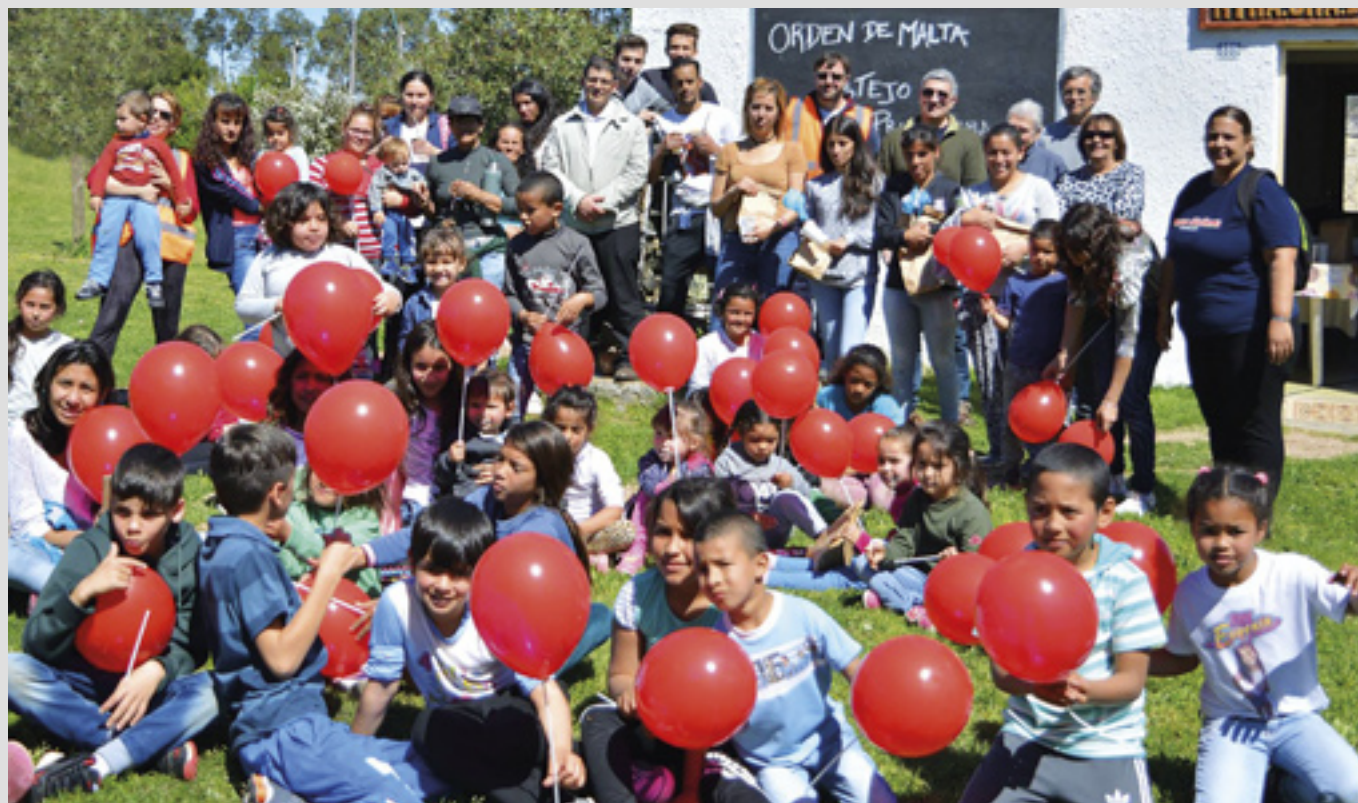
▲ Les bénévoles de l'Ordre préparent régulièrement des repas et des pique-niques pour les enfants pauvres de Montevideo en Uruguay

donné par l'association suisse), soutient la Hogar Casita del Señor, une maison pour personnes âgées, femmes aux bas revenus, construite grâce à un don de l'association; à Canelones, dans les nouveaux locaux de l'association, l'établissement résidentiel Hogar Monseñor Jacinto Vera héberge 35 jeunes mères et leurs enfants; l'hébergement de jour et de nuit Hogar La Milagrosa accueille 30 personnes par nuit et 30 par jour. L'association offre aussi une prévention et des soins dentaires dans une école de 220 élèves, à Junta Local. Initiatives en matière d'éducation : des cours de catéchisme et d'arithmétique pour les enfants vivant dans une des maisons de Montevideo; un centre de formation à l'informatique dans les locaux de l'association à Canelones. La Cocina Solidaria 2017 a nourri 70 enfants pauvres dans la Fortaleza Barrio à Montevideo, pendant la saison froide (1 000 déjeuners et 3 000 "empanadas" servis).