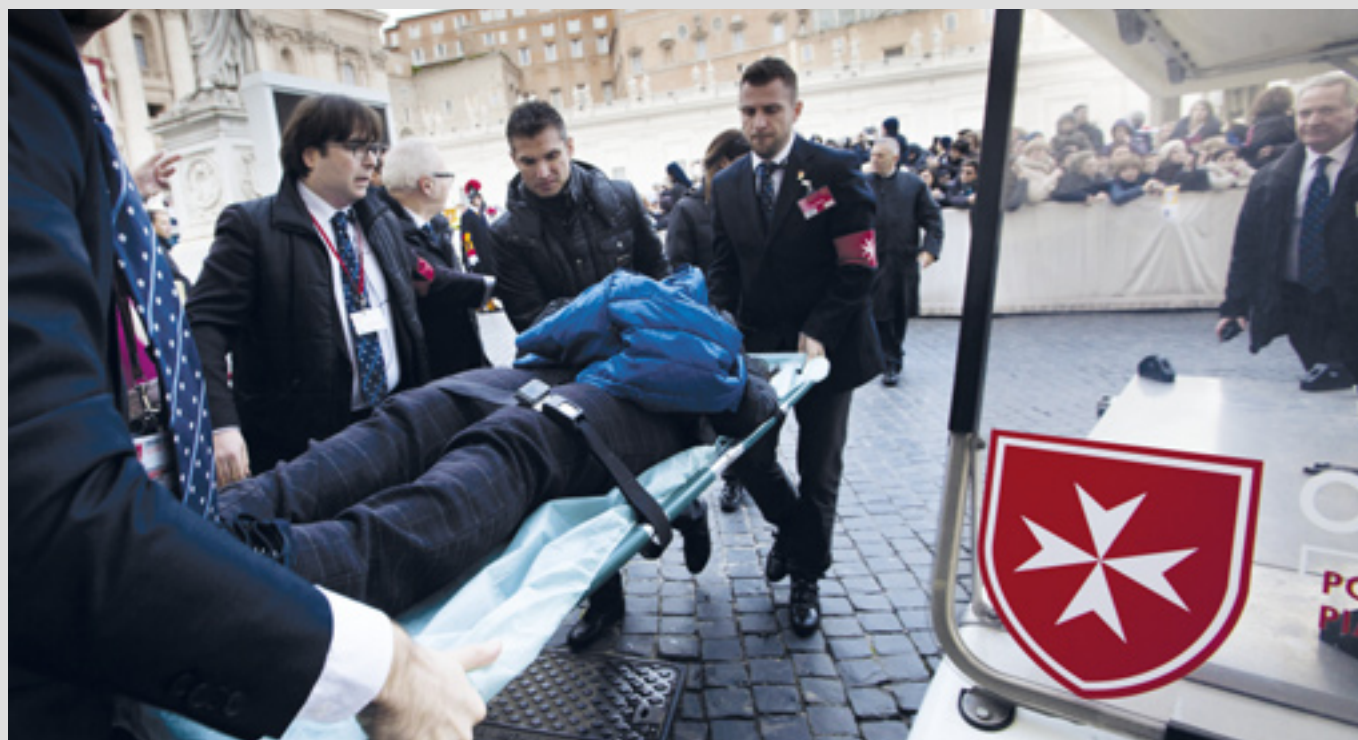
▲ Le poste de premiers secours œuvre chaque jour des deux côtés de la Place Saint Pierre

Depuis avril 2018, des services de premiers secours à San Paolo Fuori le Mura et San Giovanni in Laterano ont été ajoutés.