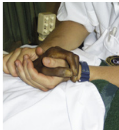
Le centre de soins et l'hospice réconfortent les malades et les mourants qui, autrement, souffriraient seuls et sans traitement

Pour plus d'information : www.bsg.org.za