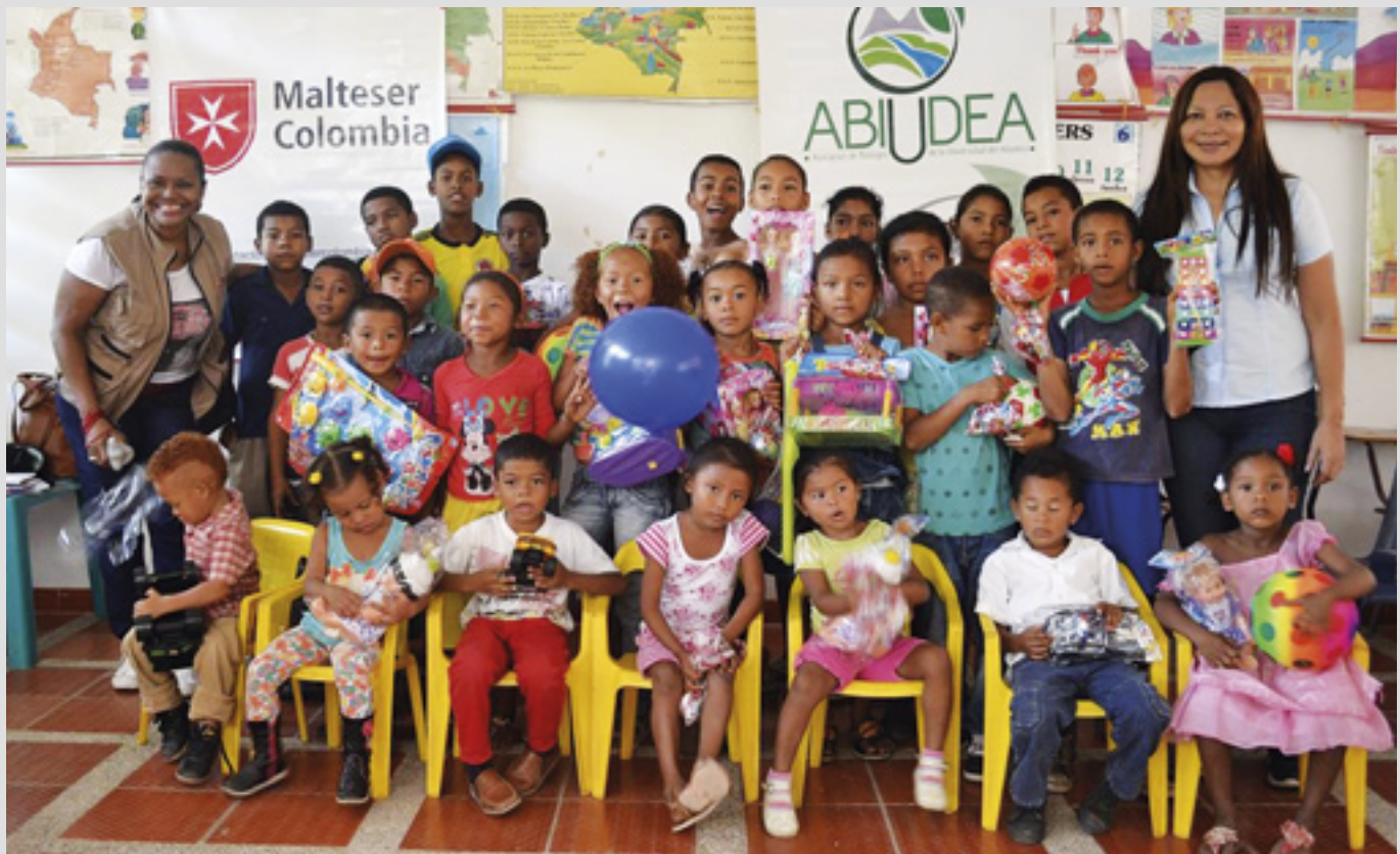
▲ Le large éventail de projets en Colombie pour aider les réfugiés et les groupes autochtones dans les régions défavorisées comprend des activités éducatives pour les plus jeunes.

cas. Il soigne actuellement 300 patients et leurs familles.