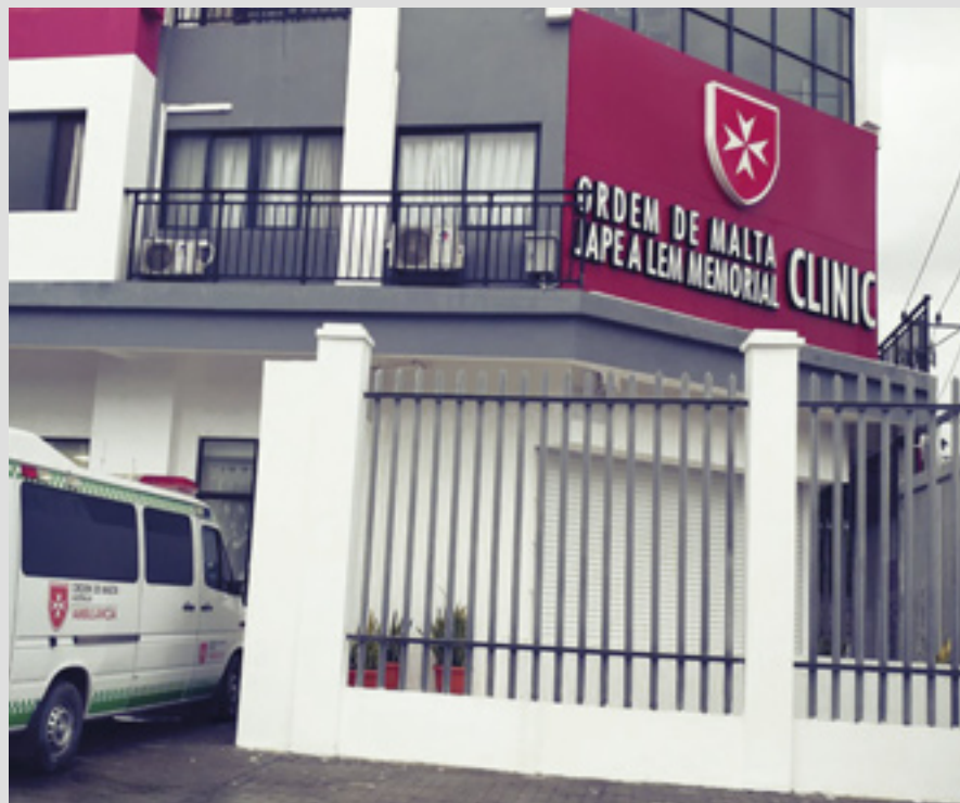
▲ La clinique de l'Ordre au Timor oriental accueille 200 patients pas jour

L'Ordre de Malte France dirige 6 centres médicaux dans le pays avec des blocs opératoires spécialisés dans le traitement de la lèpre. Les centres de Ben San, Cantho, Nha Trang, Quy Hoa et Hô-Chi-Minh-Ville s'occupent de chirurgie réparatrice pour les lépreux, à Diling le traitement concerne le diabète et les ulcères dus à la lèpre et à Quy Hoa la spécialisation est l'ophtalmologie.