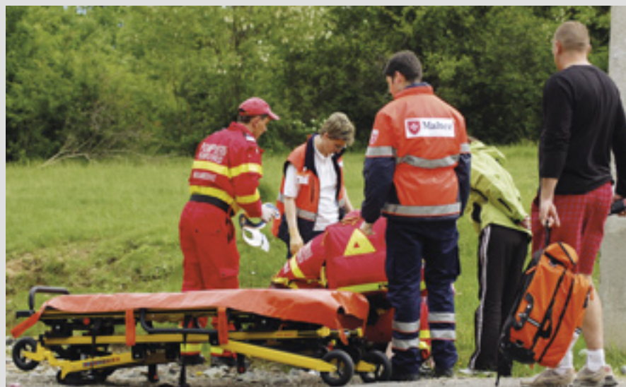
▲ Des cours réguliers de premiers secours pour bénévoles dans le Serviciul de Ajutor Maltez, Roumanie : 1 000 d'entre eux travaillent dans 100 projets dans 26 lieux différents

Les projets d'aide aux enfants : le jardin d'enfants de l'Ordre à Cluj pour 22 jeunes handicapés, un programme périscolaire pour intégrer les enfants fragiles à Aiud, un centre de jour à Blaj