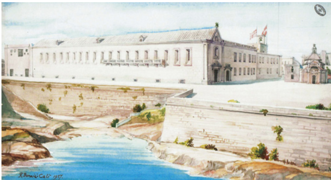
La Sacra Infermeria, Malte