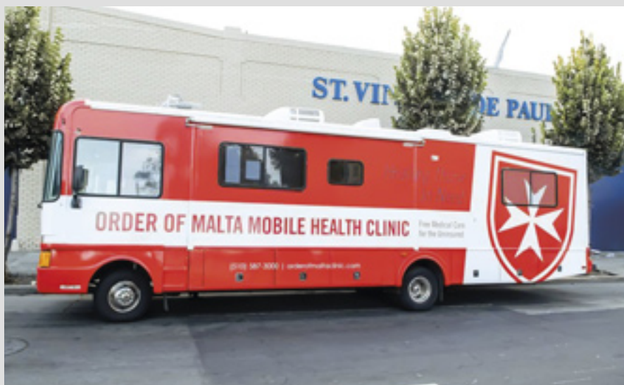
▲ La clinique mobile gratuite de la Western Association de l'Ordre à Oakland, en Californie, a soigné plus de 3 000 patients en 2018

Nevada colombienne. Un centre médical fournit des médicaments et des soins dentaires, une source d'eau et une éducation EAH.