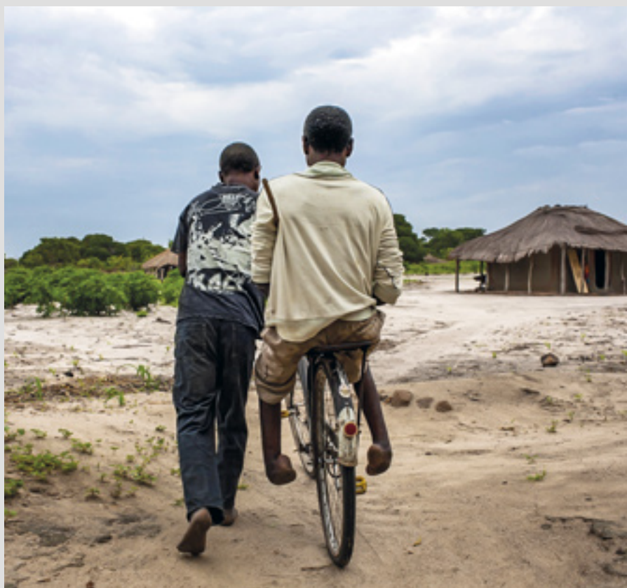
▲ Au Mozambique, l'Ordre travaille avec les victimes de la lèpre, offrant des soins spécialisés et des formations