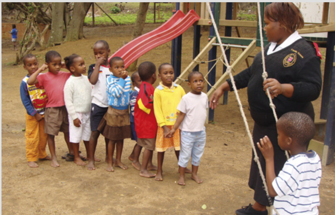
▲ À la Fraternité du Bienheureux Gérard, en Afrique du Sud, des enseignants travaillent avec de jeunes orphelins