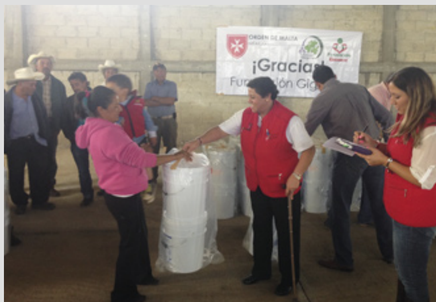
▲ Distribution d’équipement de filtration de l’eau après des catastrophes naturelles

Pour les Journées mondiales de la jeunesse de 2019, l’Ordre envoie 110 bénévoles paramédicaux de France, d’Alle-