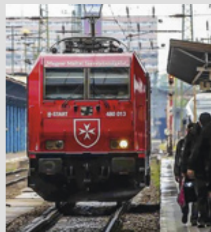
▲ Le Service de Bienfaisance hongrois travaille dans 350 lieux différents dans le pays, pour 240 000 bénéficiaires par an