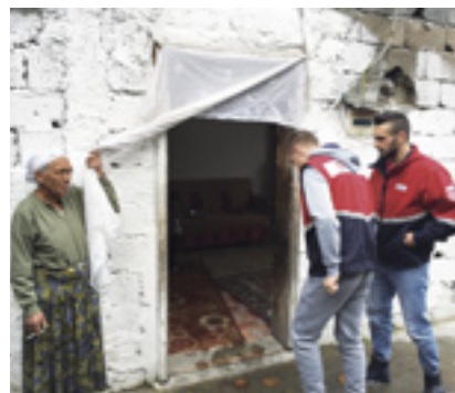
Les conditions de vie de nombreuses personnes en Albanie sont très précaires. L'Ordre apporte son soutien aux plus démunis du nord du pays