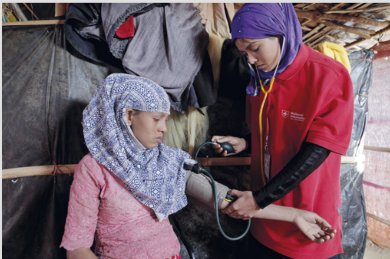
▲ Des soins pour les déplacés Rohingyas dans les camps de réfugiés

En 2017, l'ambassadeur de l'Ordre au Kazakhstan a poursuivi son aide aux Missionnaires de la Charité (Sœurs de