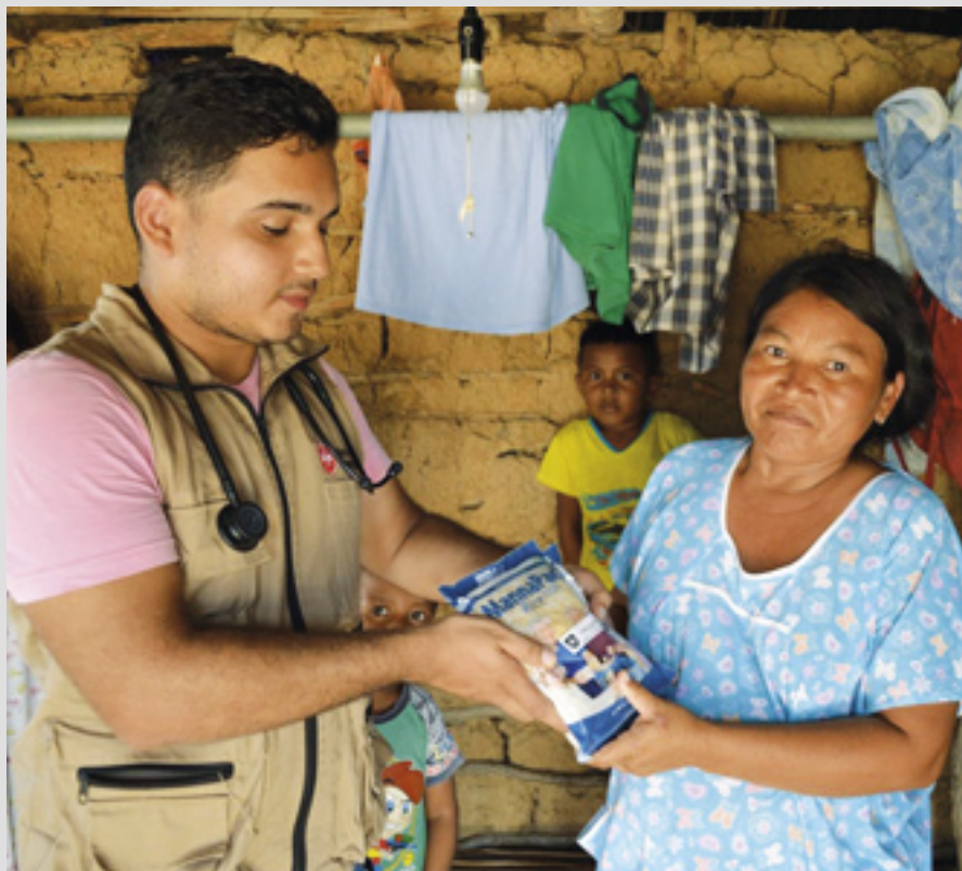
▲ Des kits d'urgence sont distribués après les inondations désastreuses en Colombie

Pour la prévention des catastrophes, sont stockées à l'entrepôt Almagora 200 tentes pour basses températures, 200