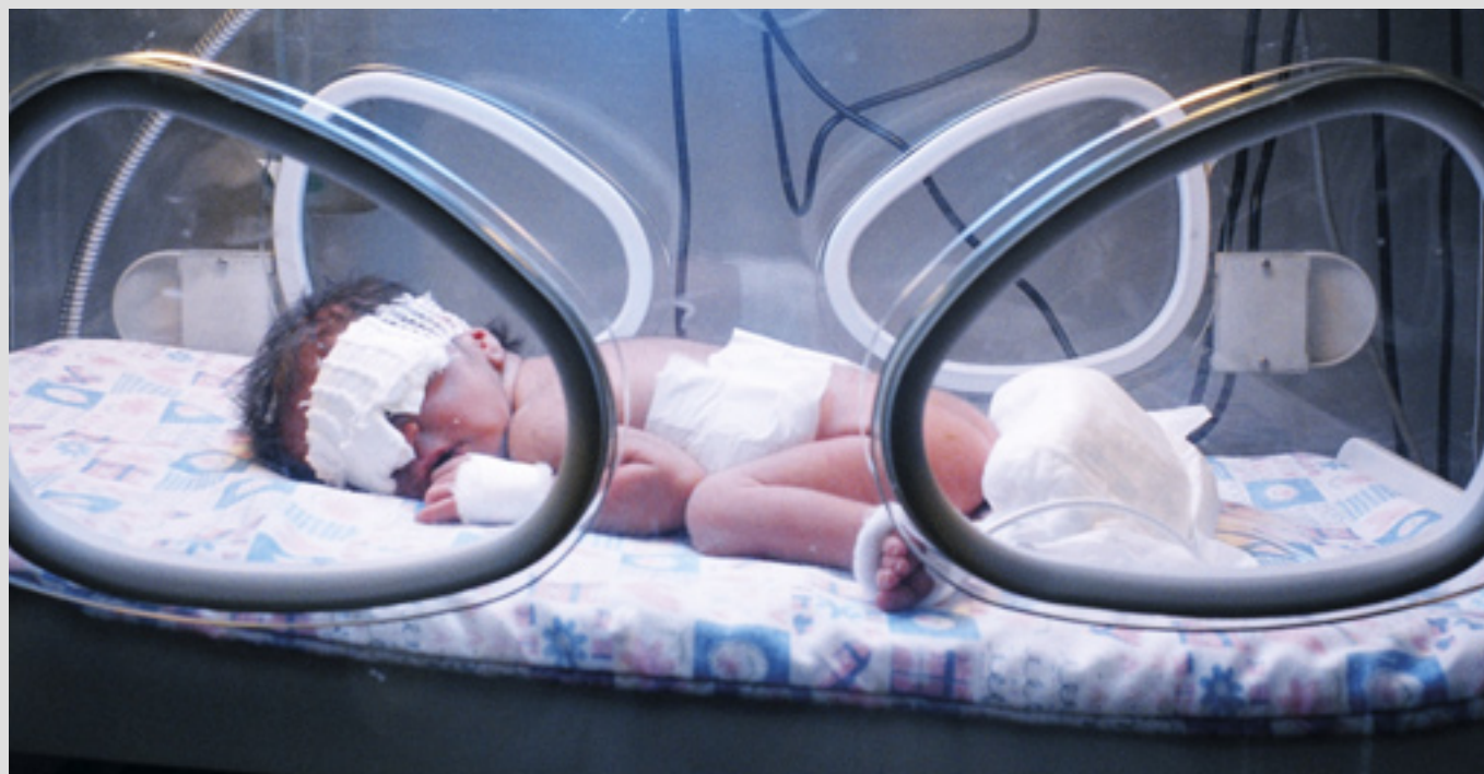
▲ L'Hôpital de la Sainte Famille de l'Ordre à Bethléem offre la seule unité de soins intensifs pour nouveau-nés dans la région

Un programme Dignity Loan lancé en 2013 dans la région de Salfit par le bureau représentatif de l'Ordre en Palestine continue d'accorder des prêts à finalité microéconomique aux petites entreprises locales, créant des emplois et augmentant les résultats économiques. En consultation avec les partenaires des communautés locales, les prêts à taux zéro ont généralement un délai de remboursement de 1 à 3 ans, les bénéficiaires sont guidés et encadrés, et les remboursements sont orientés vers la