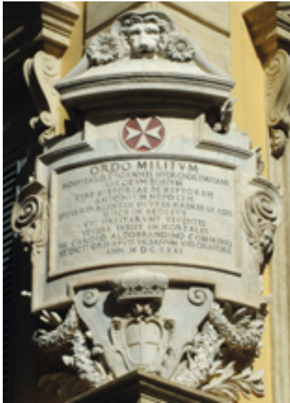
Plaque commémorative, Palais magistral, Rome

Libye et les conflits extrêmement sérieux au Moyen-Orient avec une inquiétude particulière pour les Syriens et Irakiens.