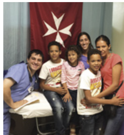
Des missions médicales bénévoles en République dominicaine traitent les habitants gratuitement et assistent des milliers de patients chaque année

En 2017, la clinique San Juan Bosco a célébré ses 25 ans de service auprès de la communauté des pauvres à Miami, qu'ils soient en situation régulière ou non. Les membres de l'Association cubaine continuent de donner de leur temps et plus de 800 patients sont vus chaque année et, si nécessaire, sont dirigés vers des spécialistes qui effectuent plus de 2 800 visites annuelles gratuites par an.