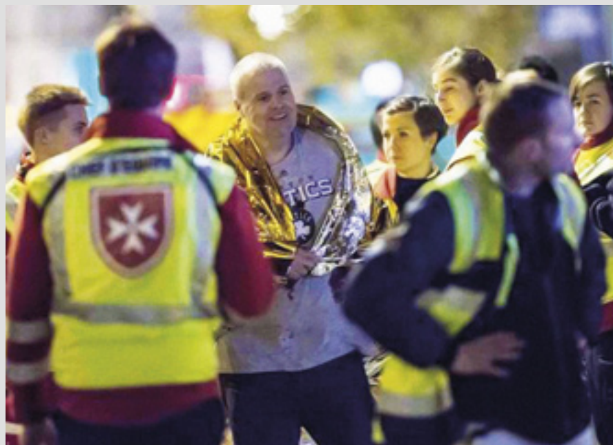
▲ Intervention de l'Ordre de Malte France lors de l'attaque du Bataclan