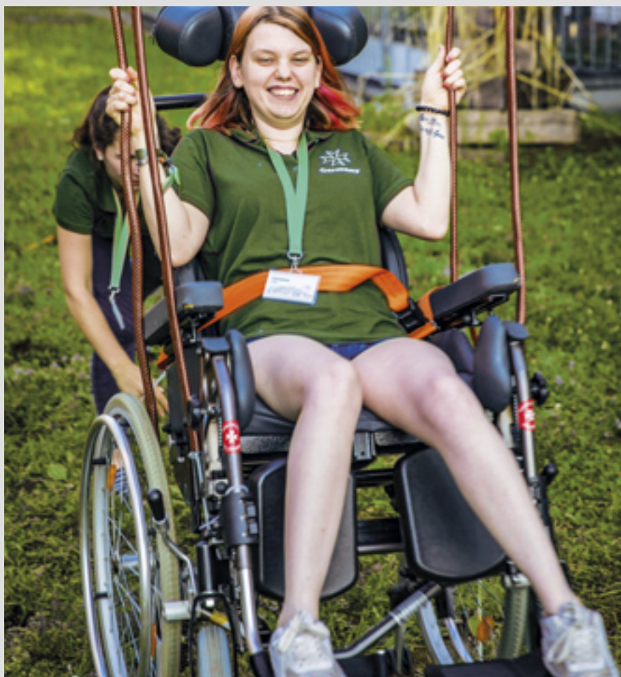
▲ 4 000 bénévoles répartis en 80 unités forment le Corps ambulancier en Irlande.

d'accueil à Szabadka. Les projets sont réalisés par plus de 600 bénévoles de l'Ordre qui travaillent dans les zones de transit. Les équipes apportent aussi un soutien (contrôles médicaux, nourritures, vêtements) aux réfugiés qui arrivent à la frontière.