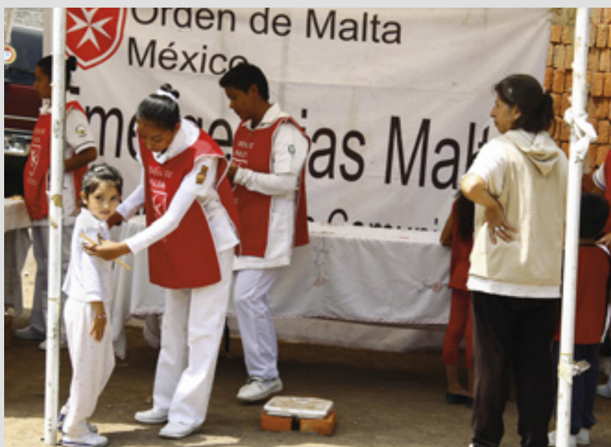
▲ Une manifestation sur la santé pour les jeunes défavorisés de Mexico

Au Pérou, les activités de l'association péruvienne de l'Ordre incluent : une fête de Noël pour les enfants pauvres dans les villages autour de Lima (Valle Amauta et Puruchoco à Ate, San Isidro, Chosica et Cañete); des campagnes dans des écoles avec la distribution de cahiers et de fournitures scolaires à plus de 200 enfants dans les communautés de Santa Teresita et Chuquibambilla dans la jungle; des soins médicaux pour environ 11 000 malades par mois dans l'église Divin enfant Jésus de l'Ordre, à Pamplona Baja, dans le sud de Lima; des soins médicaux et des distributions de médicaments aux communautés locales le long du Río Napo grâce à un accord avec la marine péruvienne; le don de 440 kg de poisson à la Maison de Santo Toribio de Mogrovejo où des membres de l'association péruvienne travaillent avec des enfants et des adultes. Les donations comprennent aussi des vêtements et