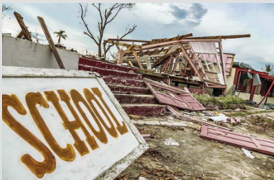
▲ L'Ordre mène des programmes de réduction des risques de catastrophes dans le sud de l'Asie où les ouragans constituent un phénomène régulier

ment très fructueux : construction de citernes de collecte des eaux de pluie dans cinq écoles, construction de latrines dans cinq écoles et 16 villages ainsi que des campagnes contre la dengue dans 32 villages.