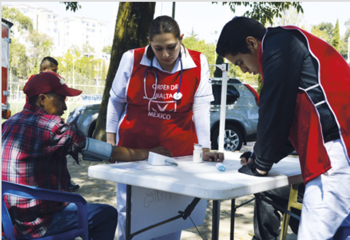
▲ Parmi les nombreuses activités de soutien de l'Ordre : des colis alimentaires aux médicaments pour les personnes défavorisées

Guatemala a l'un des taux de malnutrition chronique les plus élevés au monde : 4 enfants sur 10 en souffrent. Le projet Hospice Ammaraydando, avec sept chambres, une clinique et une pharmacie, accompagne les patients en phase terminale.