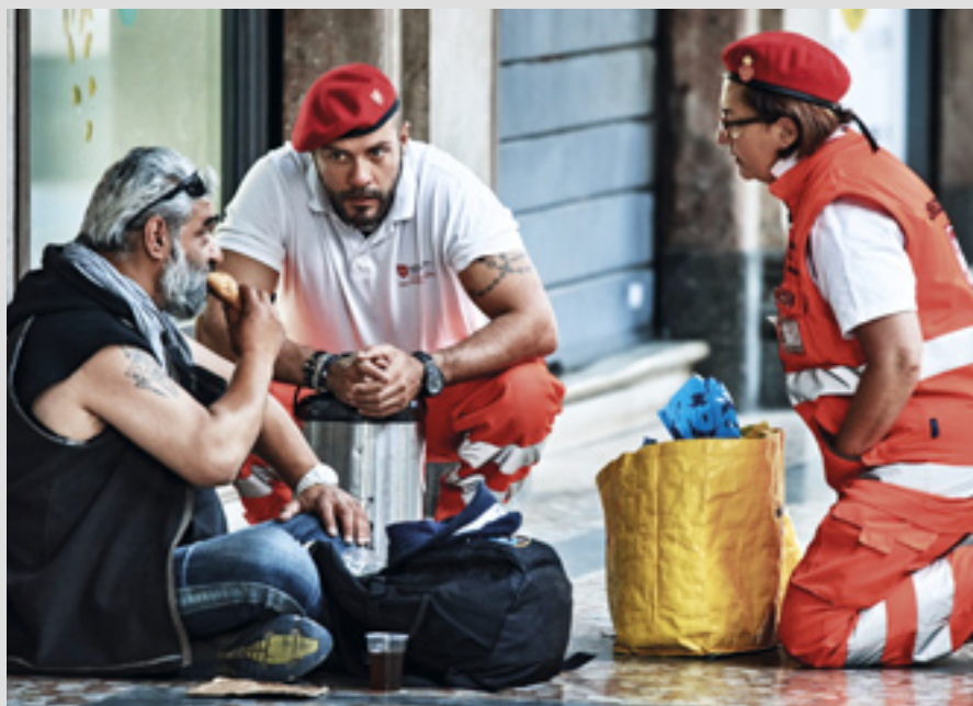
▲ Le Corps de secours italien mène plusieurs activités dont la distribution de nourriture aux plus démunis

En 2016, le Grand Magistère a fait don d'une clinique mobile et d'un mini-van