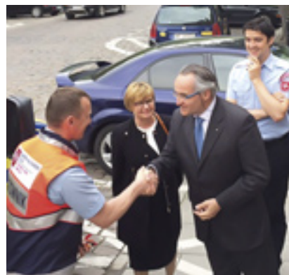
Le Grand Hospitalier félicite les équipes de bénévoles de l'Organisation de secours polonaise de l'Ordre qui travaillent dans des projets d'aide médicale et sociale dans le pays