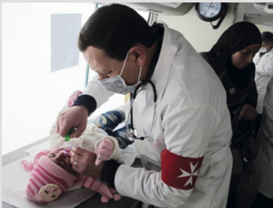
▲ Un petit réfugié syrien pris en charge dans une clinique médicale mobile de l'Ordre dans le nord du Liban

Avec la libération de Mossoul en 2017, ses habitants ont commencé à revenir progressivement, mais la situation est précaire, d'un point de vue médical et social. Malteser International distribue des biens de première nécessité, reconstruit progressivement des structures de santé et offre un soutien psycho-social aux personnes traumatisées. Il intensifiera son travail de formation et de génération de revenus et a lancé les programmes "Cash for Work" dans lesquels de nombreuses femmes participent à des cours promouvant la bonne hygiène, devenant enseignantes