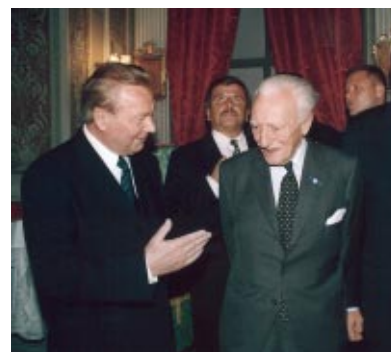
Slovaquie - S.E. Rudolf Schuster