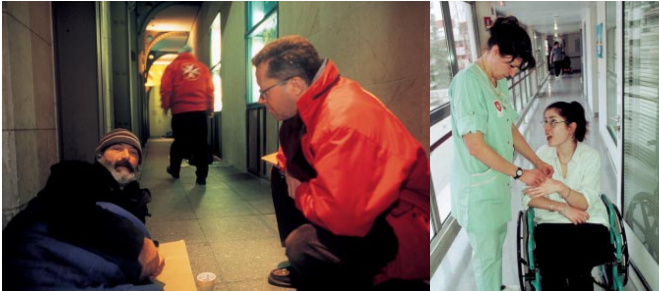
En France, l'aide aux sans-abri et une clinique pour personnes handicapées

ciation de l' Ouest des Etats-Unis : la fourniture d'équipement médical de pointe à l'hôpital Arco Iris qui accueille une partie des 30 000 enfants vivant dans les rues de La Paz. Compte tenu des donations encore à recevoir, l'Ordre aura récolté en tout 1 400 000 dollars américains pour financer ce projet.