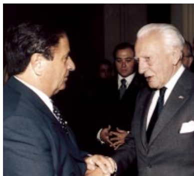
Argentine - S.E. Eduardo Duhalde