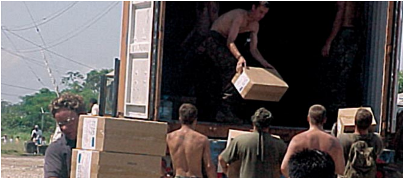
Des équipes de bénévoles de l'Ordre distribuent des médicaments à la population locale au Belize

Le Grand Prieuré d' Autriche a continué à collecter, à trier et à redistribuer des médicaments et du matériel médical à des hôpitaux, à des résidences pour personnes âgées et à des crèches en Europe de l'Est.