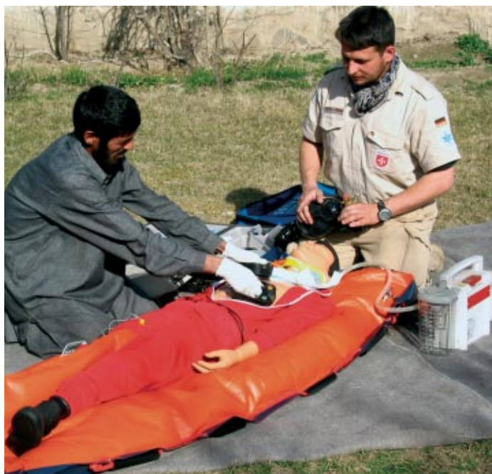
L'association allemande organise des cours de secourisme toute l'année. Celui-ci s'est déroulé en Afghanistan

L'Ordre de Malte travaille dans le respect de normes nationales et internationales régissant les premiers soins, le secours d'urgence et l'aide humanitaire. De cette façon, nous sommes sûrs que toutes nos interventions sont réalisées comme il se doit, au plus grand bénéfice de ceux que nous aidons.