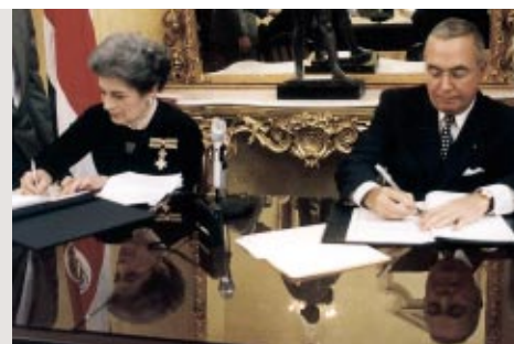
L'Ambassadeur de l'Ordre au Costa Rica signe une convention de coopération avec le Ministre costaricain de la Santé en mars 2002

En 2001 et 2002, l'Ordre de Malte a signé six conventions de coopération dans le but de venir en aide à des pays sollicitant diverses formes de soutien, que ce soit des programmes d'aide humanitaire destinés à fournir des services sociaux ou de secours, des soins aux personnes âgées et handicapées, ou des programmes d'appui et de conseil aux structures hospitalières et sanitaires nationales.