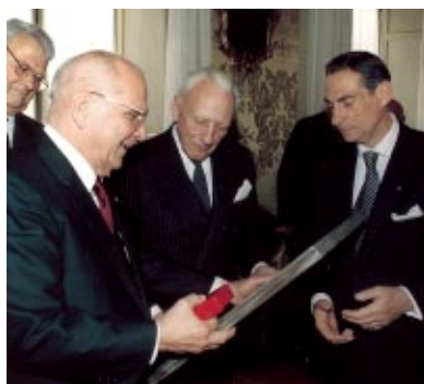
Nicaragua - S.E. Enrique Bolaños Geyer