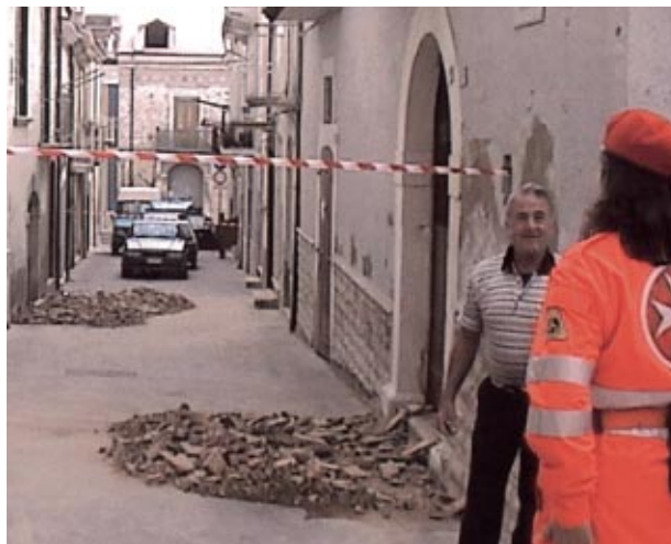
Cette photo d'une rue de Casalnuovo Monterotaro, près de Foggia, dans le sud de l'Italie, donne une idée des dégâts

L'Association mexicaine de l'Ordre a fourni une aide humanitaire aux victimes de catastrophes naturelles, en particulier