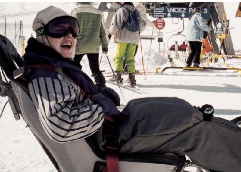
Le plaisir de la glisse, grâce aux bénévoles de l'Association française

L'Association de l'Ordre en Macédoine a poursuivi son programme d'aide aux enfants gravement handicapés de Demir Kapia, près de Skopje. Dans ce cadre, elle a fourni, entre autres choses, des médicaments et des vêtements aux patients.