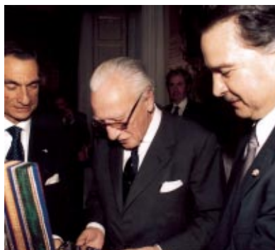
Guatemala - S.E. Alfonso Portillo Cabrera