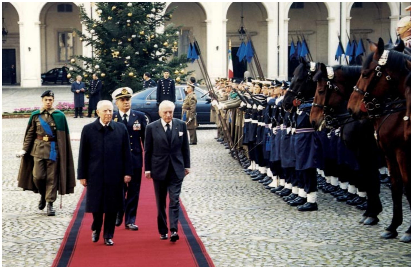
Le Grand Maître est reçu par le Président de la République italienne, S.E. Carlo Azeglio Ciampi, à l'occasion d'une visite officielle