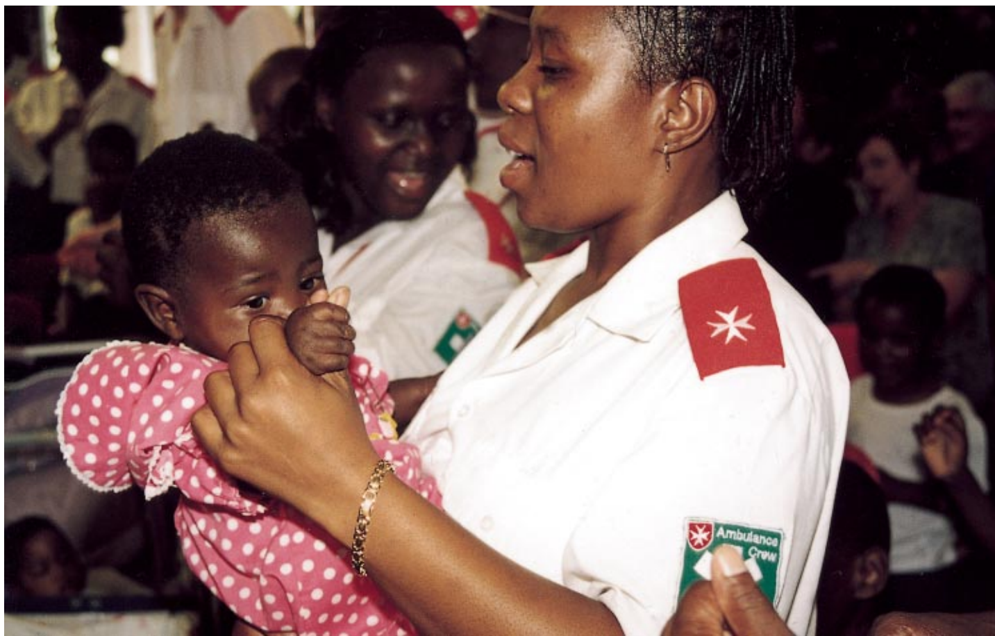
En Afrique du Sud, le centre de soins palliatifs de l'Ordre s'occupe des mères séropositives ou atteintes du sida et de leur bébé