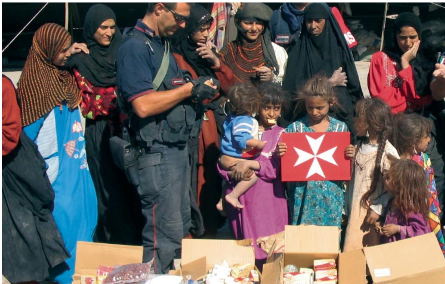
Les Irakiens viennent chercher les vivres et les médicaments fournis par l'Association italienne de l'Ordre

l'Irak et que leurs homologues français passeraient par la Jordanie, avec l'aide de l'ambassadeur de l'Ordre au Liban, pour se concentrer sur l'aide humanitaire aux Irakiens vivant à Bagdad et aux alentours.