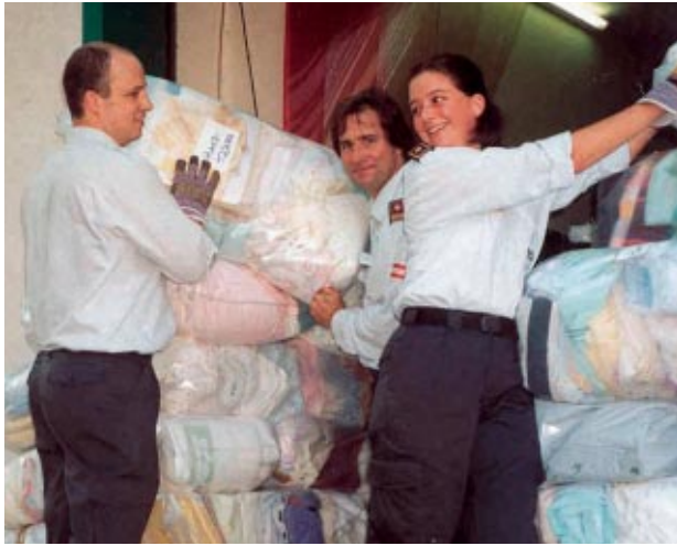
Été 2002: des bénévoles autrichiens déchargent du matériel destiné aux victimes des inondations en Europe centrale

Trois tonnes de matériel médical ont également été hélicoptérées du siège de l'Association hondurienne de l'Ordre au centre de dispatching établi à Punta Gorda, avant d'être réexpédiées vers 11 villages inaccessibles par voie terrestre. La distribution de l'aide d'urgence, qui comprenait également des vivres (riz, haricots, farine, conserves), a été coordonnée par l'Ordre sous la direction de l'Office national de gestion des secours d'urgence du Belize.