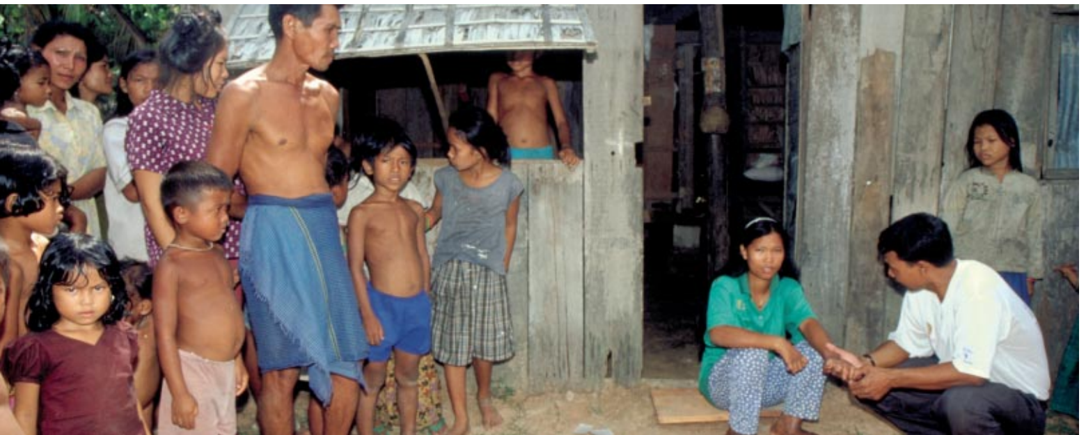
Des patients consultent un médecin du CIOMAL en Thaïlande

souffrent de handicaps dus à la lèpre. Ce chiffre ne cesse de croître.»