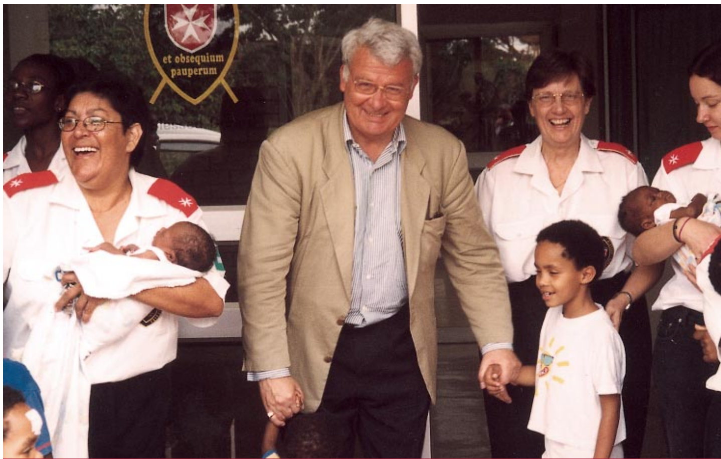
Le Grand Commandeur, Fr. Ludwig Hoffmann von Rumerstein visite le «Centre de soins palliatifs pour malades du sida» ouvert par l'Ordre à Mandini, en Afrique du Sud, à l'occasion de l'inauguration de la nouvelle aile de 53 lits et des travaux d'aménagement réalisés dans l'orphelinat voisin (décembre 2002)