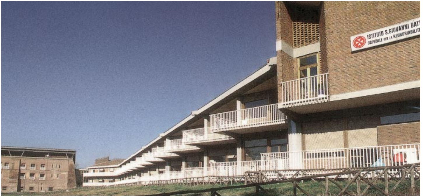
L'Hôpital de San Giovanni Battista (la Magliana)