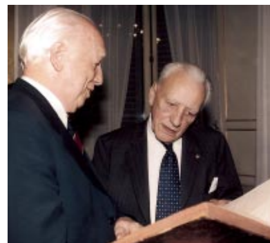
Hongrie - S.E. Ferenc Madl