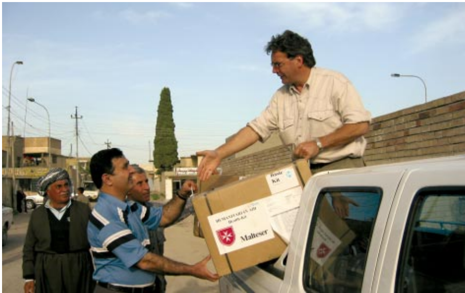
Une équipe de l'ECOM décharge des marchandises destinées aux Irakiens

«Nous avons mis en place des infrastructures de test et nous avons pris des dispositions pour permettre aux médecins locaux de suivre des cours d'initiation aux analyses de laboratoire pour améliorer leurs compétences en la matière. De la sorte, nous avons apporté une aide non seulement immédiate, mais également durable.»