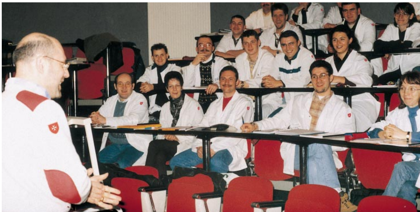
Des secouristes suivent des cours de recyclage

sur des services de médecine généraliste, plutôt que sur la réanimation) ou à des classes d'âges spécifiques.