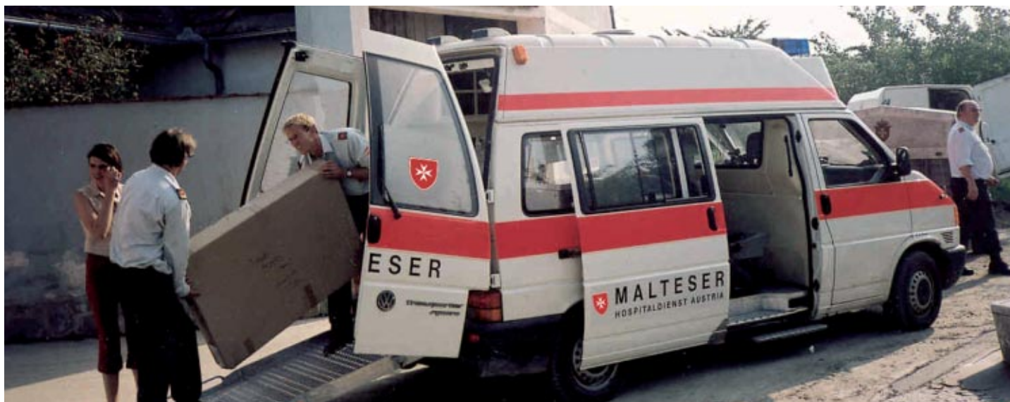
Une ambulance de l'Association autrichienne de l'Ordre en Basse-Autriche, en été 2001