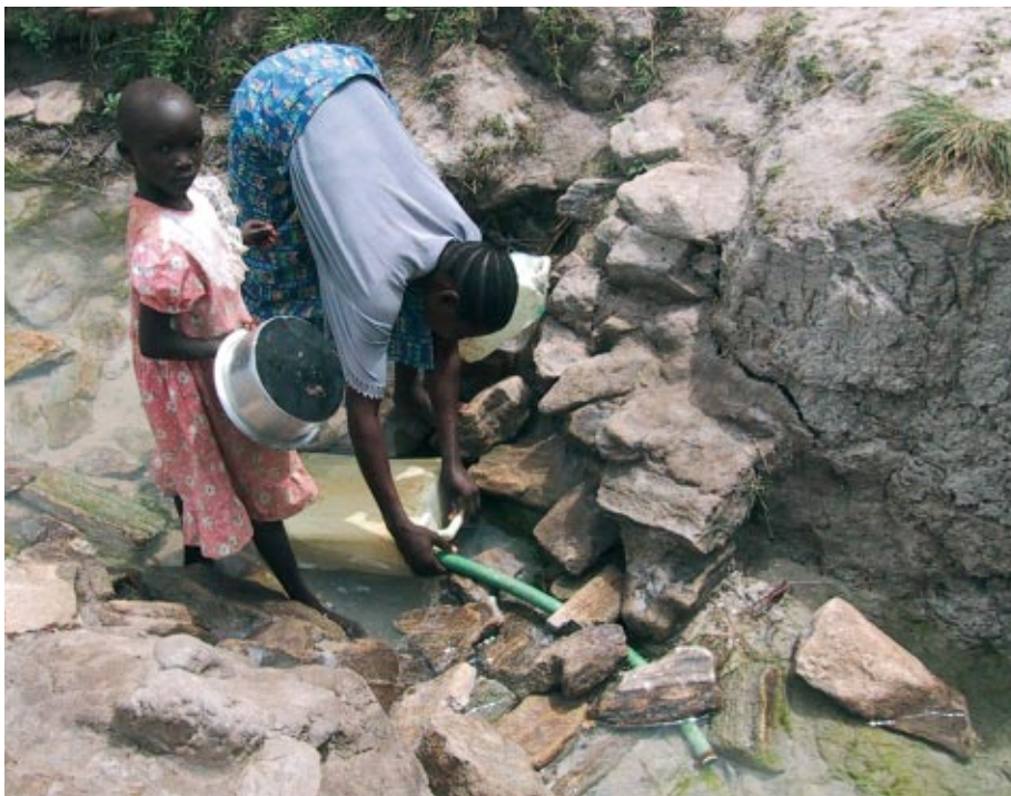
L'Association allemande a fourni des équipements d'épuration d'eau à Ariwara, en Afrique