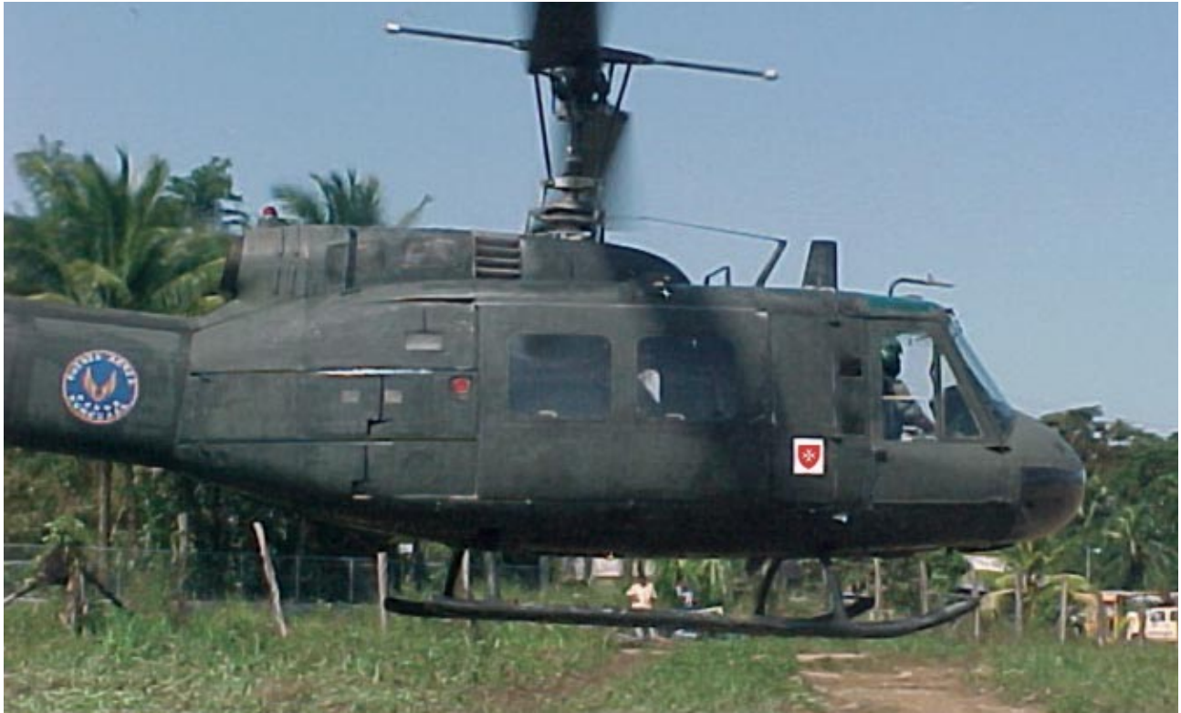
Activités de coopération: transport de matériel médical en Amérique du Sud

Parmi les projets entrepris par l'Association de l'Ordre au Guatemala , citons la distribution de médicaments dans 1 410 établissements en 2003, les visites à domicile des bénévoles médicaux, l'aide aux sans-abri et les services d'orthodontie pour enfants dans des centres de soins régionaux.