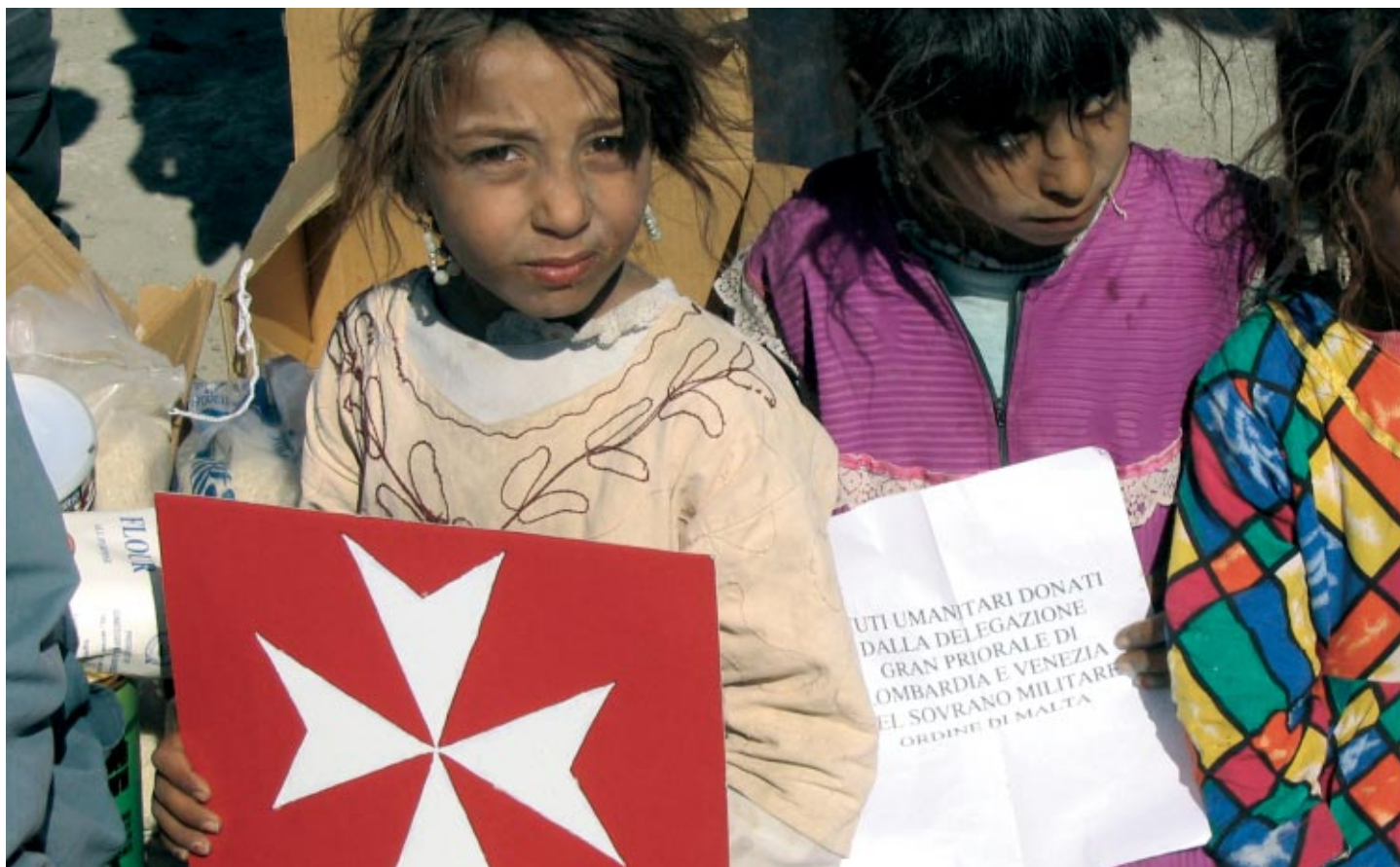
Des personnes déplacées attendent leur tour devant la clinique de l'Ordre dans le nord de l'Afghanistan. Les dons proviennent du Grand Prieuré de Lombardie et de Venise