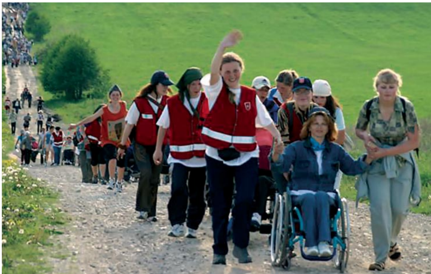
Un pèlerinage de jeunes en Lituanie durant l'été 2002