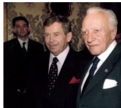
République tchèque - S.E. Vaclav Havel