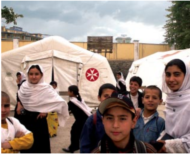
Des personnes déplacées sont accueillies dans un dispensaire de l'Ordre en Afghanistan