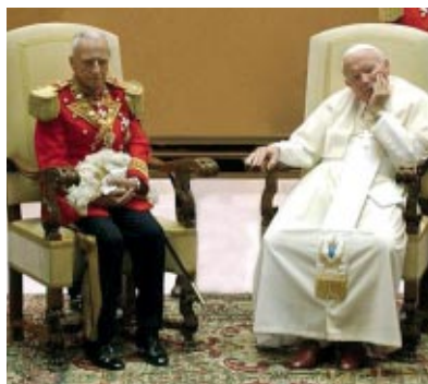
Saint-Siège - Sa Sainteté le Pape Jean-Paul II