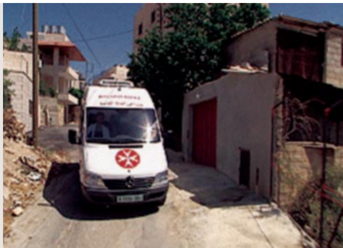
À Bethléem, des ambulances vont chercher les femmes sur le point d'accoucher pour les emmener à la maternité

Ce sont les Œuvres hospitalières françaises de l'Ordre qui supportent ce lourd fardeau, avec l'aide des Associations nationales d' Allemagne , des États-Unis , d' Irlande et de Suisse , et celle de