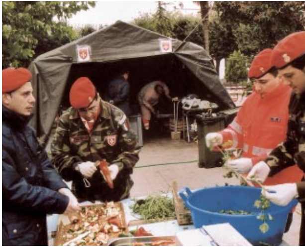
Des membres et des bénévoles du Corps militaire de l'Association italienne apportent vivres et infrastructures d'hébergement aux victimes du tremblement de terre qui a frappé le sud de l'Italie à l'automne 2002

L'Ordre a concentré ses efforts sur la mise en œuvre d'un programme global dans trois petites villes de la région. À Bad Schandau, une ville touristique située au sud de Dresde, aucun hôtel n'a été épargné par la boue qui a tout submergé. Une hausse massive du chômage a été enregistrée à Prettin, au nord de Dresde, à cause de l'inondation des champs environnants. Le chômage s'est également fait sentir plus durement à Großtreben-Zwethau en raison de l'endommagement des infrastructures locales.