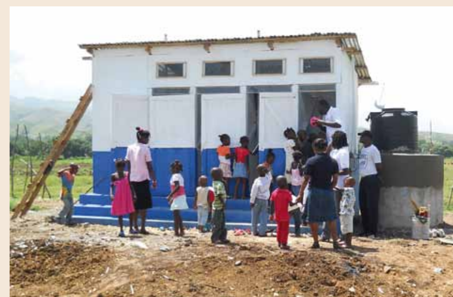
Inspecting the new facilities | Com curiosidad, las nuevas letrinas son inspeccionadas.

The ‘L’Enfant de l’espoir’ orphanage was razed to the ground by the earthquake. Its 46 orphans now live on meadow land and sleep in basic wooden huts. Their living conditions are extremely basic; there is a shortage of food and the children do not have access to safe water or suitable sanitary facilities. Malteser International has constructed three latrines here with built-in washing facilities. Using child-friendly methods, with the help of balls and playing cards, the children and young people, aged between 18 months and