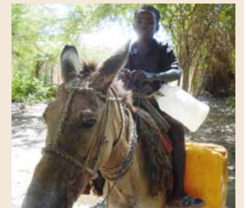
On a donkey on his way to the next well: This boy has to travel over ten kilometres to get safe drinking water for his family | Con el burro a la fuente de agua: unos diez kilómetros recorre este chico en busca de agua potable para su familia.

Les deseo que la ayuda que desde ahora reciba el país no se limite a paliar los efectos inmediatos del temblor. También deben atenderse las necesidades que ya existían antes del temblor. Sólo así esta catástrofe podrá convertirse para Haití en una oportunidad de vivir un futuro mejor. Y también espero que el gobierno del país sepa aprovechar esta oportunidad.