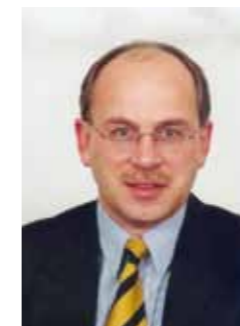
Ingo Radtke Secretary General | Secretario general

On 12 January 2010, Haiti was struck by a 60-second earthquake. A few seconds cost thousands of people their lives and livelihoods, destroyed buildings, streets and dreams, and took away the land and the hopes of many. Over 230,000 fatalities, around 300,000 injured, more than one million homeless, and totally destroyed infrastructure: in short, one of the worst natural disasters of the 21st century.