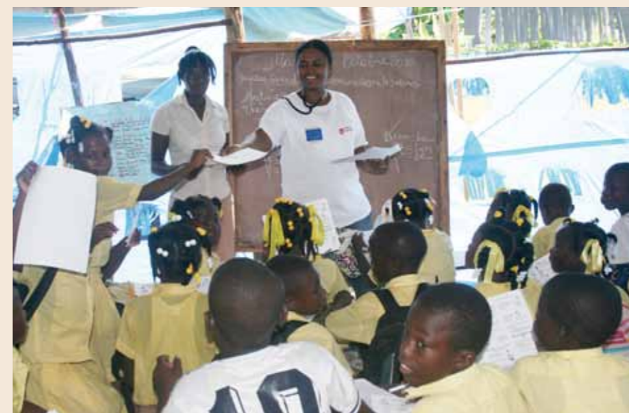
“How can I protect myself from cholera?” – Awareness training – especially at schools – is vital | “¿Cómo puedo protegerme de cólera?” Trabajo educativo – como se muestra en esa escuela – es vital.

He ayudado en muchas catástrofes en diversos países. La situación de los niños siempre me afecta especialmente. Porque representan el futuro de sus respectivos países. La educación juega un papel crucial también para ellos. Cuando veo lo arreglados, limpios y bien peinados que los niños haitianos salen de sus casas por la mañana, camino de su escuela, me doy cuenta del enorme esfuerzo que algunas familias hacen para poder enviar a sus hijos a clase, conscientes de la enorme importancia de la educación. Por ello, en nuestros programas escolares intentamos concienciar a todos del derecho inalienable de los niños a la educación, un derecho que debería garantizarse por ley. Sólo así podremos facilitarles un futuro mejor e independiente.