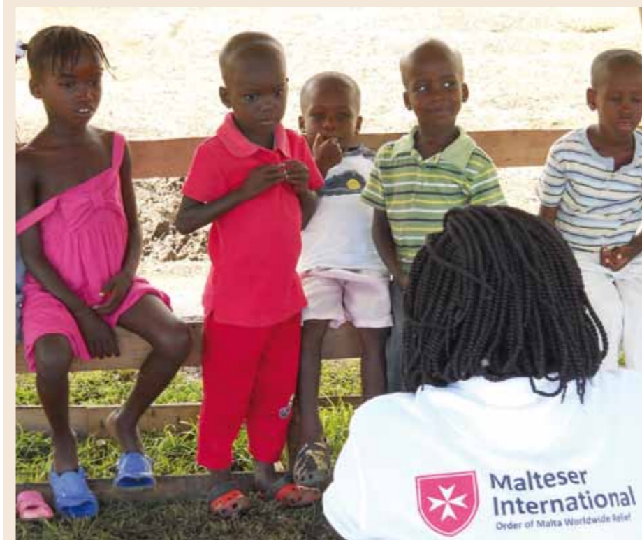
“Don’t forget to wash your hands!” – The children learn hygiene in play settings. “No te olvides de lavarte las manos!” De forma lúdica los niños aprenden prácticas de higiene adecuadas.

18 years, have also been taught the importance of the new latrines and the significance of proper hygiene.