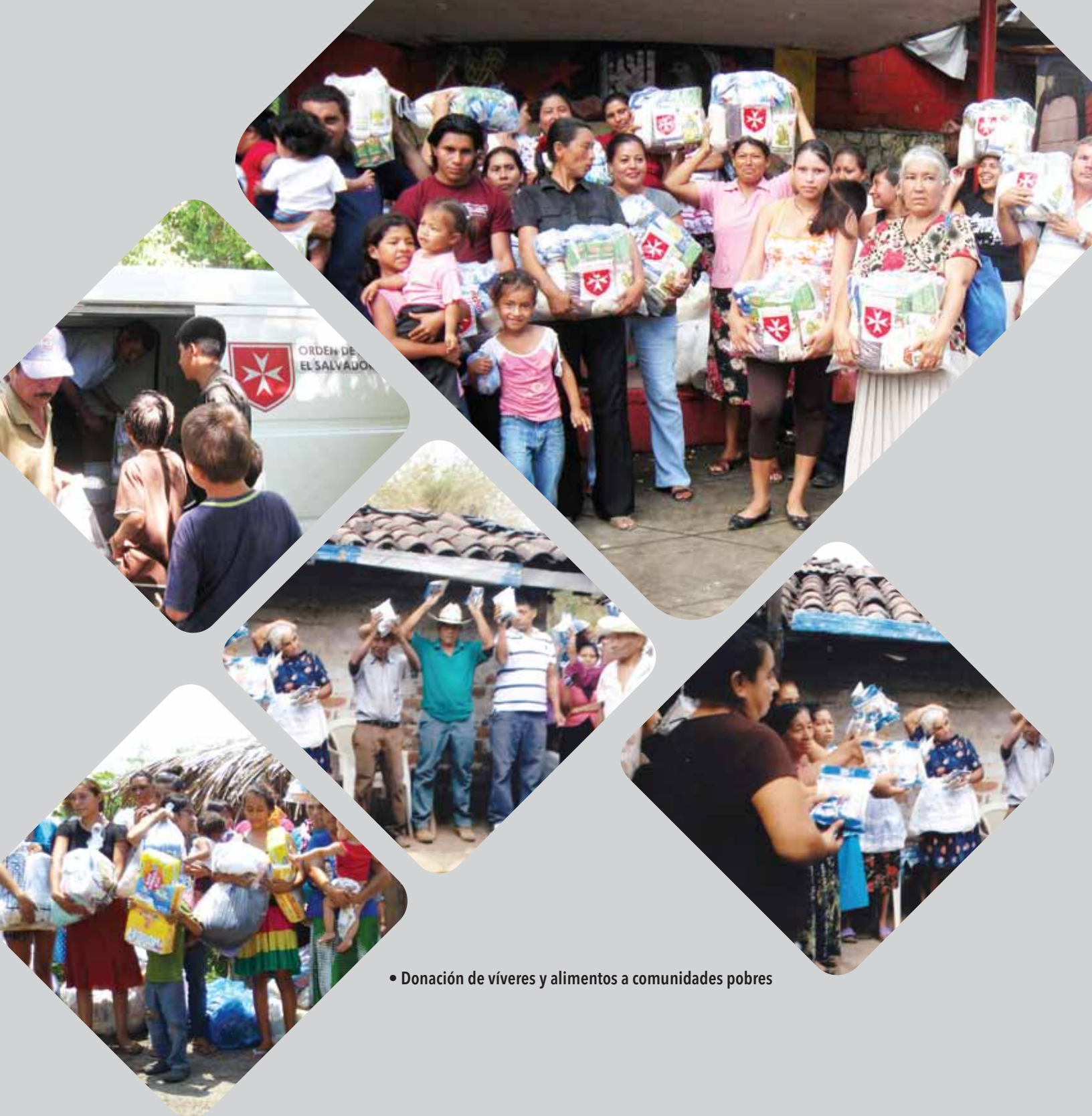
• Donación de víveres y alimentos a comunidades pobres